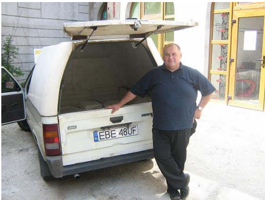
Zdjęcie nr 2: Eko-rolnik