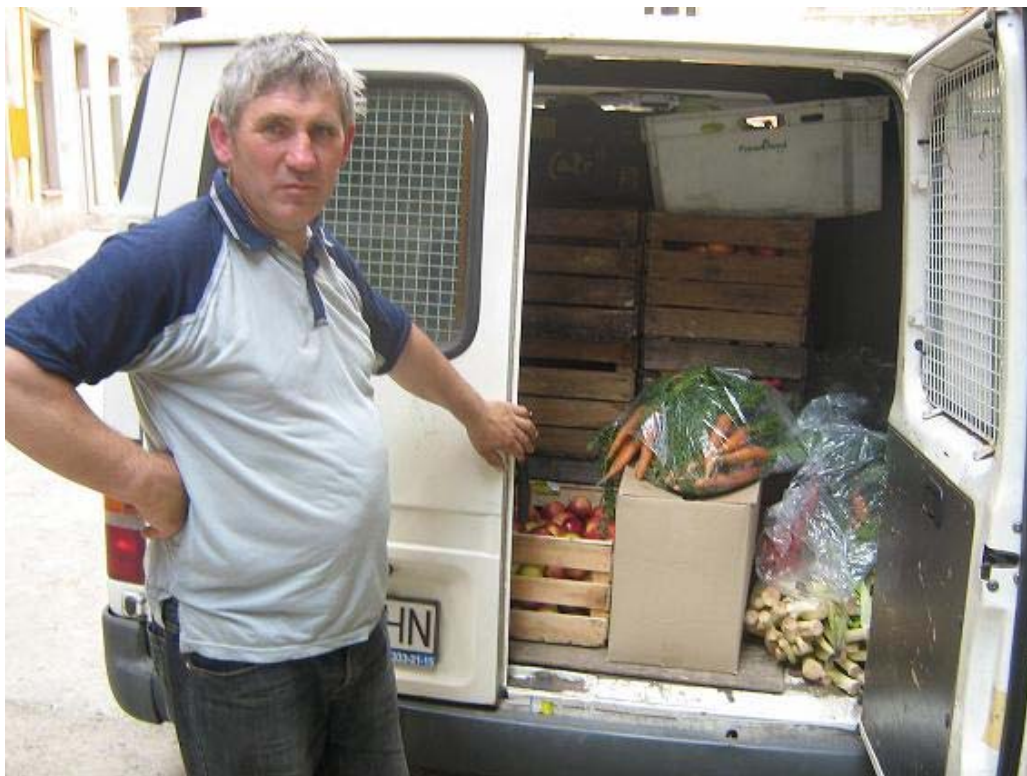
Zdjęcie nr 1: Eko-rolnik