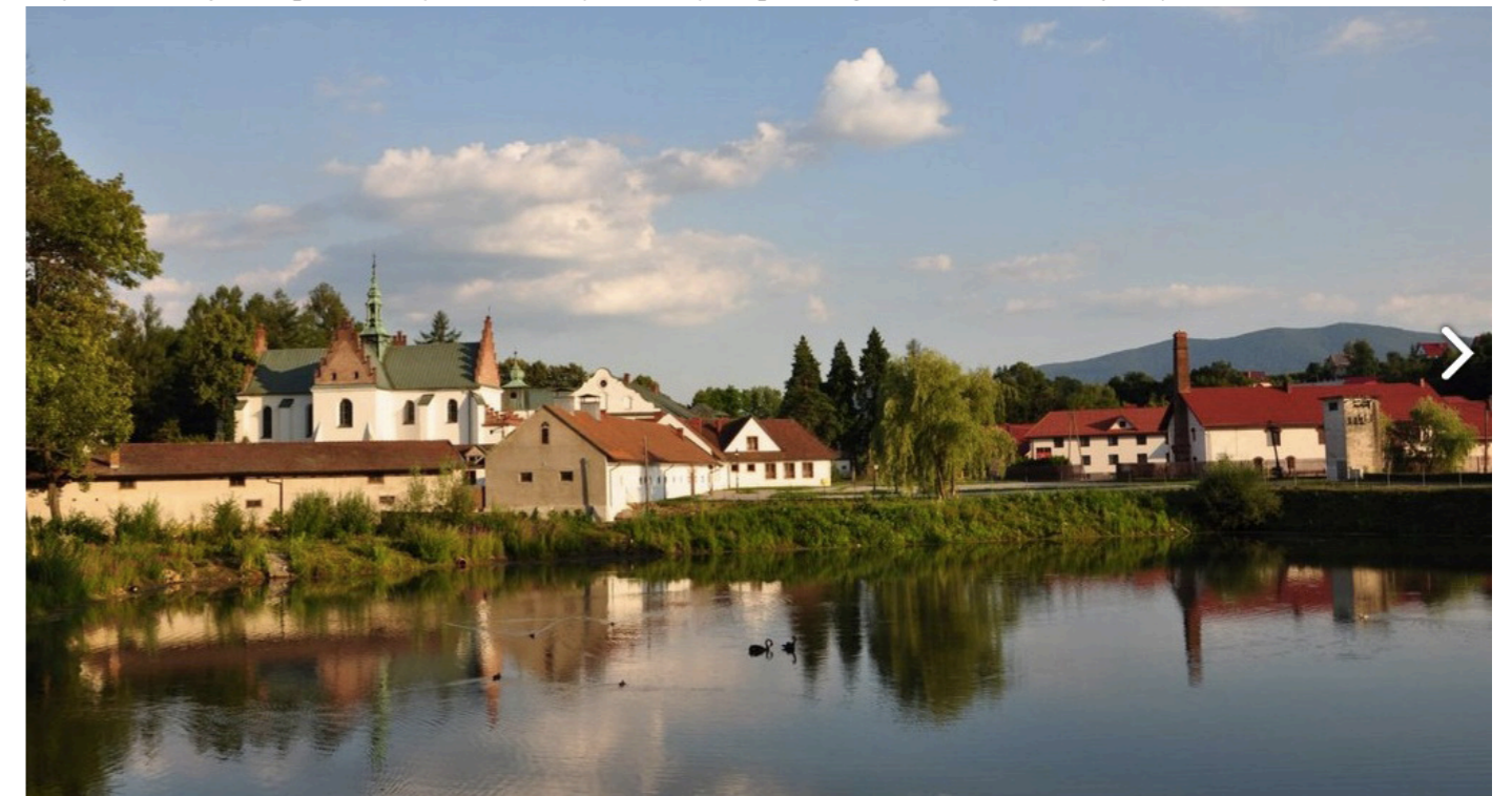
Zdjęcie 2. Przykład prezentacji klasztoru jako miejsca pięknego – strategia estetyzacji.