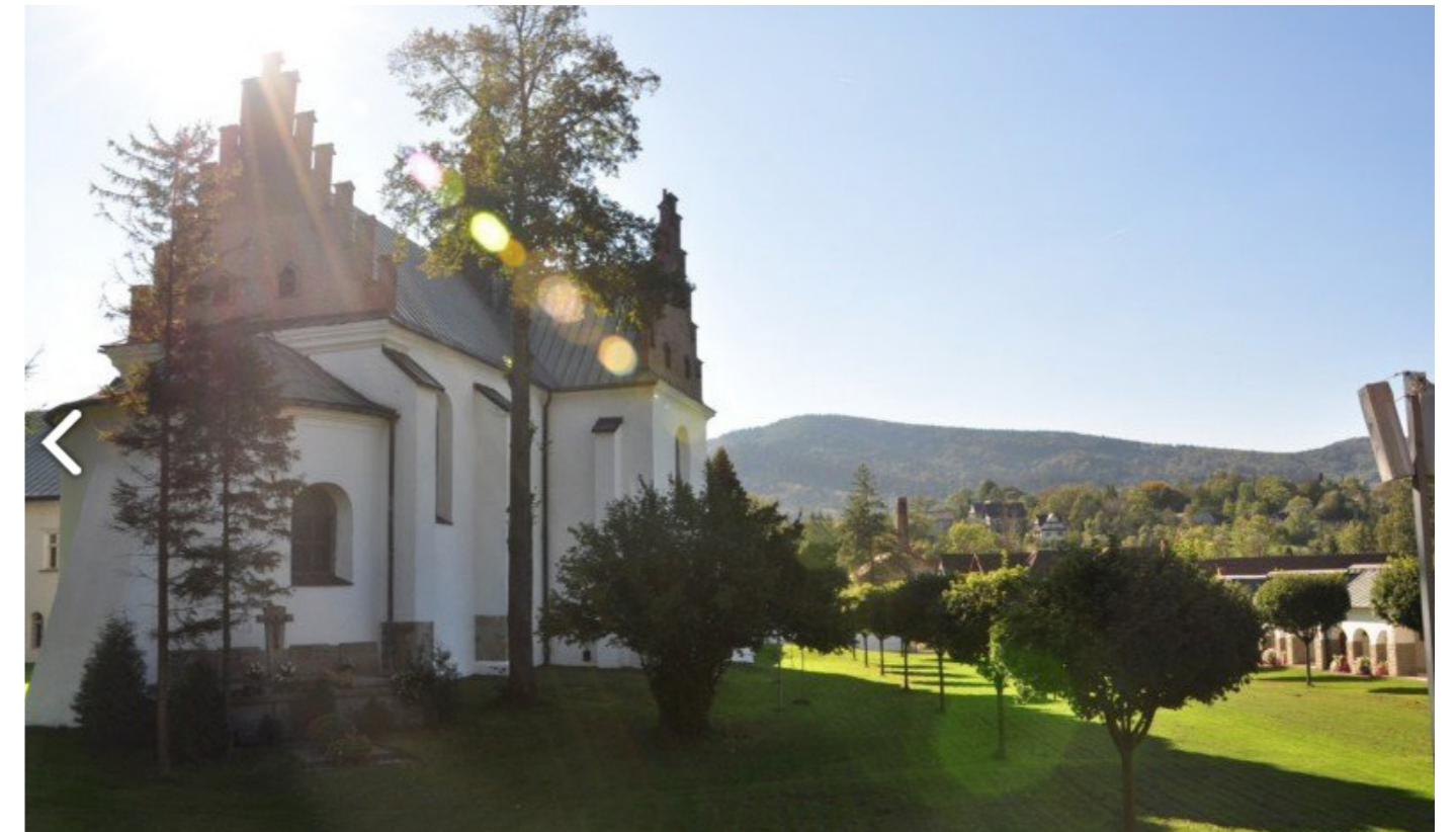
Zdjęcie 1. Przykład prezentacji klasztoru jako miejsca pięknego – strategia estetyzacji.

Kategorie pozareligijne, za pomocą których zakodowano „klasztor”, to: estetyzacja, podkreślanie walorów architektonicznych, uspołecznienie, w tym podkreślanie historycznego związku z kontekstem lokalnym oraz podkreślanie cysterskości.