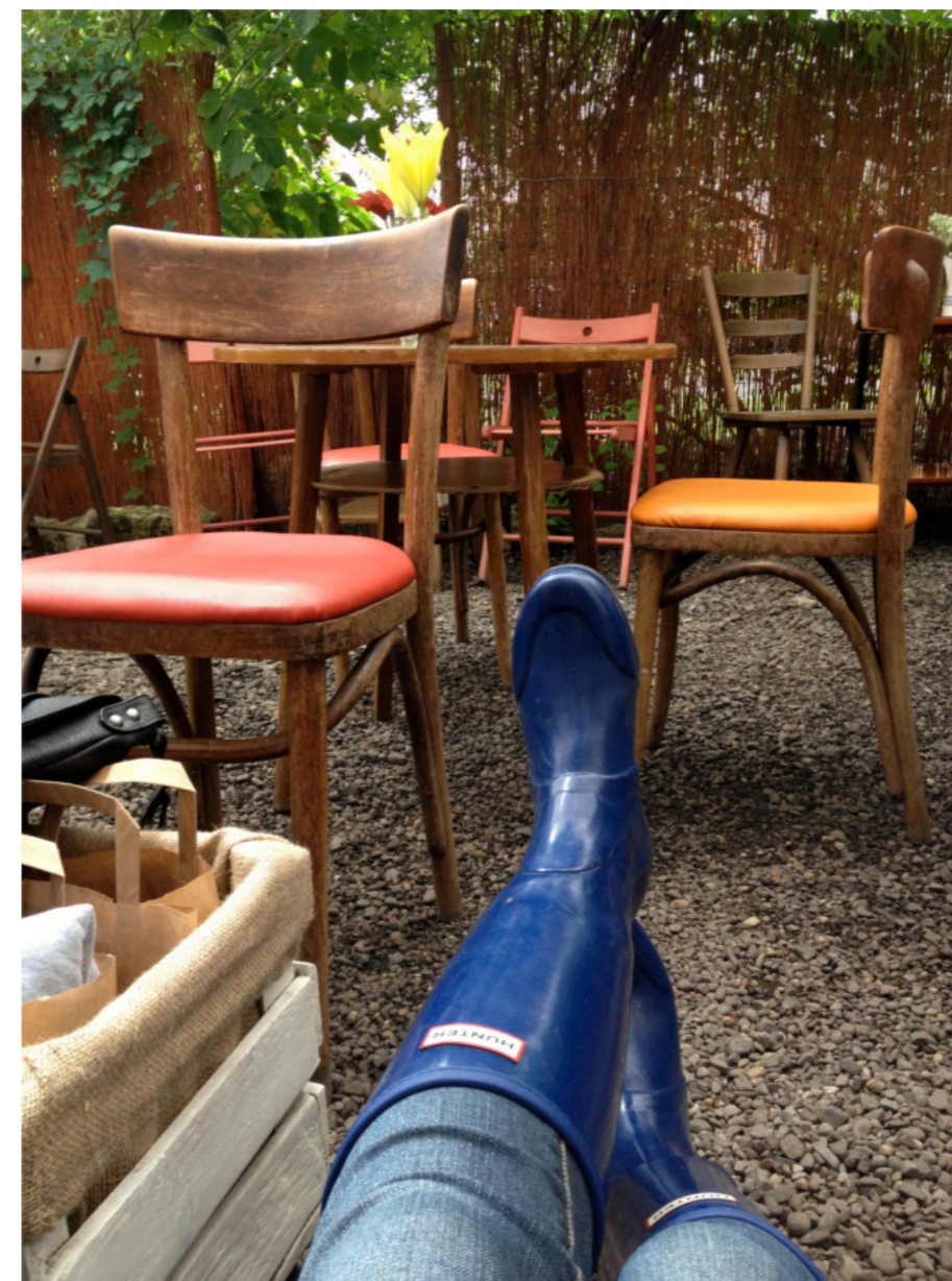
Fot. 2. Stan odrobienia.

Wiesz co, jak mogę sobie tak usiąść po prostu. [...] mimo tego, że mam siedzącą pracę i tam siedzę przy biurku, to chyba znów siedzenie mi się z tym kojarzy. Ale takie, gdy mogę wyciągnąć nogi przed siebie i założyć ręce za głowę. (niedoczasy, K, 28)