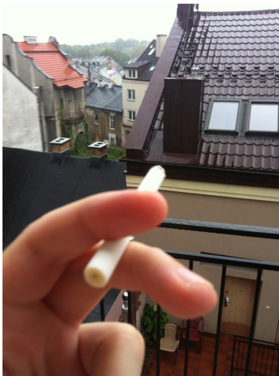
Fot. 1. Stan odrobienia.

mem, gdyż okazje mają to do siebie, że nie trzymają się planów.