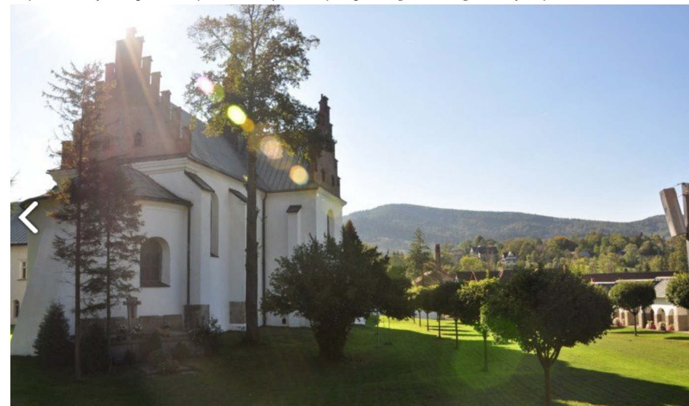
Zdjęcie 1. Przykład prezentacji klasztoru jako miejsca pięknego – strategia estetyzacji.

Kategorie pozareligijne, za pomocą których zakodowano „klasztor”, to: estetyzacja, podkreślanie walorów architektonicznych, uspołecznienie, w tym podkreślanie historycznego związku z kontekstem lokalnym oraz podkreślanie cysterskości.