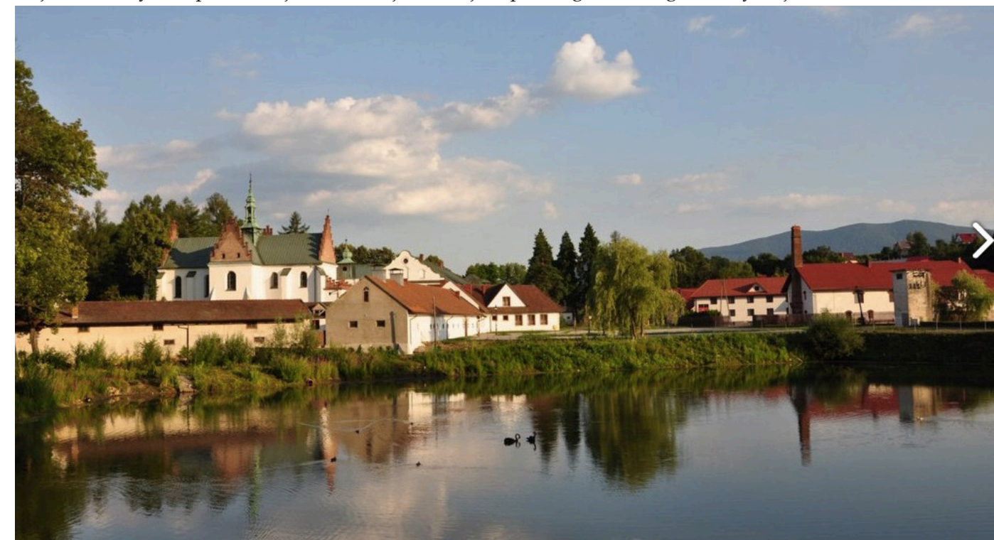
Zdjęcie 2. Przykład prezentacji klasztoru jako miejsca pięknego – strategia estetyzacji.