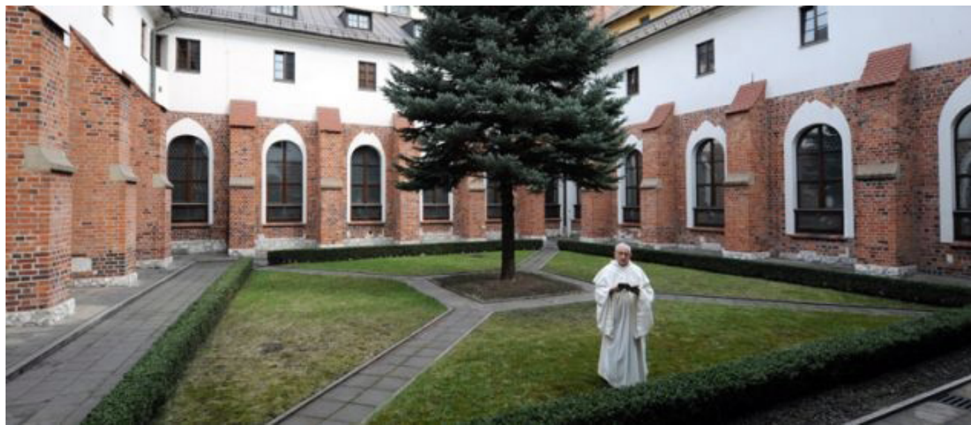
Zdjęcie 3. Przykład prezentacji klasztoru jako miejsca pięknego – strategia estetyzacji.