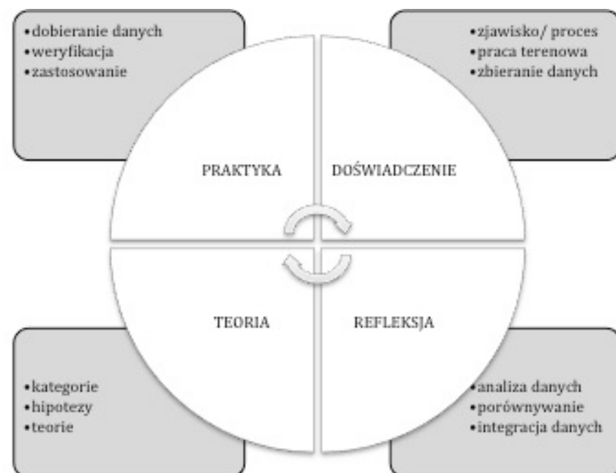
Diagram 2. Cykl doświadczeniowego generowania teorii.

Teoria ma swoje określone miejsce, powstając poprzez refleksję po doświadczeniu i kształtując praktykę wobec tego doświadczenia. Aby pozostawać użyteczną w pragmatycznym rozumieniu, musi tym samym wyłaniać się z działania (a nie samego tylko aktu rozumowania) i być weryfikowaną w działaniu (a nie jedynie poprzez ocenę intelektualną czy emocjonalną). Nakładając na model Kolba i Fry kolejne kroki procesu badawczego, uzyskujemy cykl generowania teorii – od wstępnego gromadzenia danych, poprzez ich analizę, wnioskowanie, zastosowanie, obserwację efektów i kolejne zbieranie danych, analizę, uzupełnianie hipotez i ich zastosowanie, weryfikację, integrację, aż do ostatecznego wyłonienia teorii dającej się wykorzystać w praktyce i dalej modyfikować (rozwijać) poprzez doświadczenie.