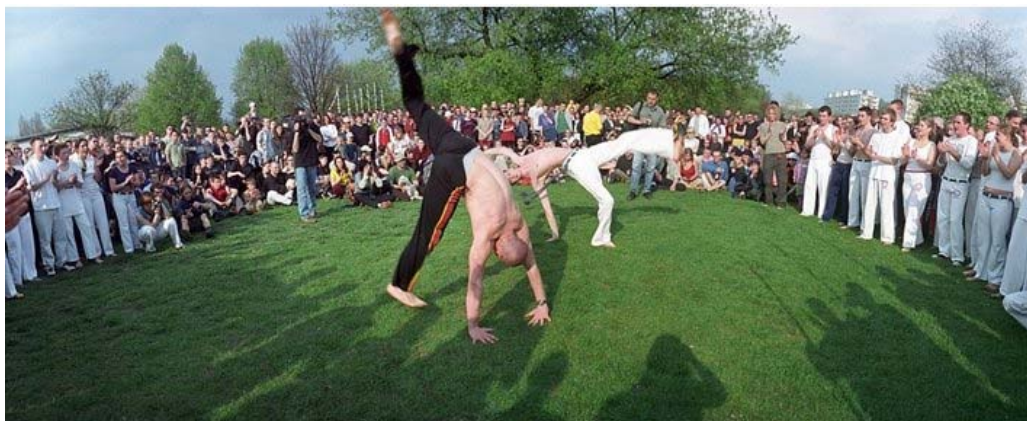
Fot. 1. Capoeira jako zjawisko świeże, egzotyczne i porywające, wpływała na zaangażowanych ludzi inspirująco. Zapewniając im odskocznnię od szarej rzeczywistości. Czyniąc ich performerami. Niektórzy capoeirzyści to już od lat wyrobieni tancerze, akrobaci, którzy odkryli w capoeirze kolejną przestrzeń do ekspresji ruchowej.

Z drugiej strony jawność obserwacji zawsze pociąga za sobą zmiany zachowania badanych. Relacja ta jest jednak obustronna, bowiem badacz także ulega wpływowi badanych - prowadząc badanie nie jest w stanie całkowicie zdystansować się od grupy. Można doszukiwać się tu innej wady tej techniki zbierania danych – istnieje niebezpieczeństwo utraty wrażliwości badacza na cechy badanej grupy oraz tendencja do przedstawiania obserwowanych faktów na korzyść grupy. Jednak mimo wspomnianych wad, jest to technika niezwykle użyteczna.