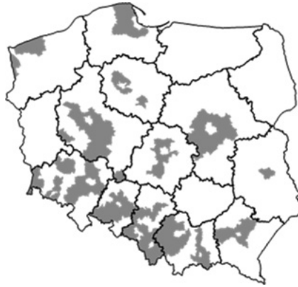
Rysunek 2. Rozmieszczenie obszarów wielofunkcyjnych zurbanizowanych

oddziaływaniem miast wojewódzkich. „Obszary funkcjonalnie miejskie ośrodków wojewódzkich” wyznaczone zostały przez Ministerstwo Rozwoju Regionalnego w oparciu o ekspertyzę Instytutu Geografii i Przestrzennego Zagospodarowania Kraju PAN (por. Śleszyński 2013) dla celów planowania przestrzennego, zawartego w „Koncepcji Przestrzennego Zagospodarowania Kraju 2030”. W znacznej mierze pokrywają się one z wyróżnionymi przeze mnie, w oparciu o wskaźnik gęstości ekonomicznej 9 , obszarami wielofunkcyjnymi zurbanizowanymi. Ich zasięg ilustruje rysunek 2 (niezaznaczona na mapie reszta terytoriów wiejskich to obszary głównie rolnicze).