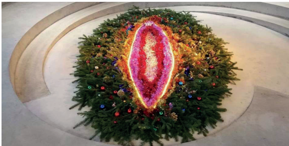
Illustration 4. Carol Bîmes, Sapine de Noël , branches de sapin, décorations de Noël, guirlandes et lumières électriques, 2019, Frac Meca Nouvelle Aquitaine, Bordeaux