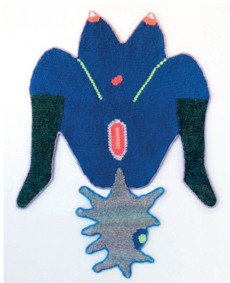
Illustration 2. Wells Chandler, Born again , laine crochétée, 2020. Courtesy de l'artiste et de la galerie Eric Mouchet

où les seins joueraient le rôle des yeux. Cette paréidolie facétieuse, comme l'iconique canard lapin qui fait voir l'un et l'autre en alternance dans la même image, s'accorde bien avec la réversibilité de cette figuration excentrique des corps. Dans ces attitudes exubérantes, le sexe féminin existe aussi dans une dynamique créative, qu'elle soit faite de fluide ou d'une chorégraphie particulière.