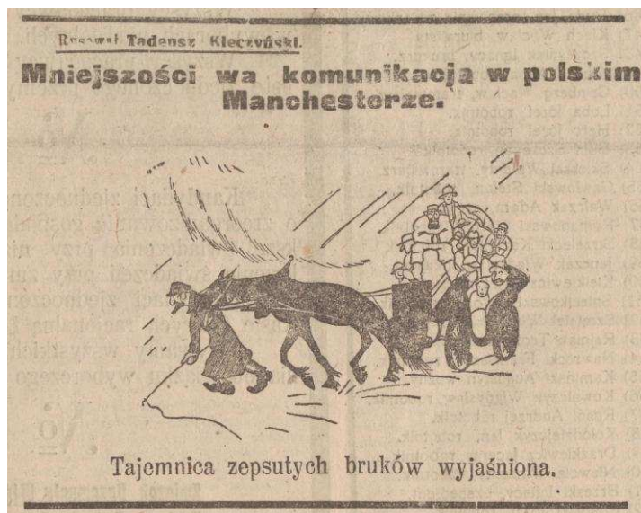
„Kurier Łódzki” 26 kwietnia 1924