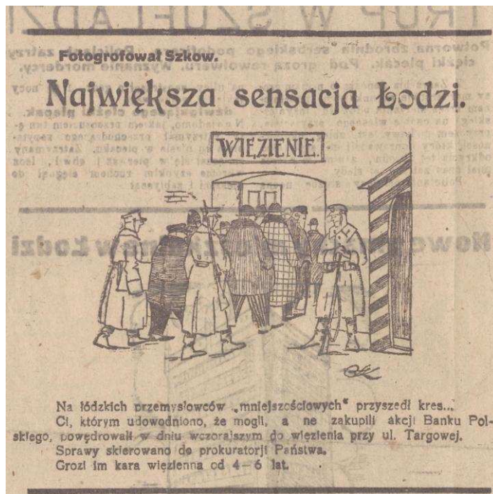
„Kurier Łódzki” 1 kwietnia 1924