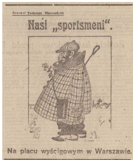
„Kurier Łódzki” 18 czerwca 1924