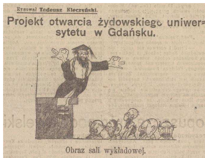
„Kurier Łódzki” 20 maja 1924