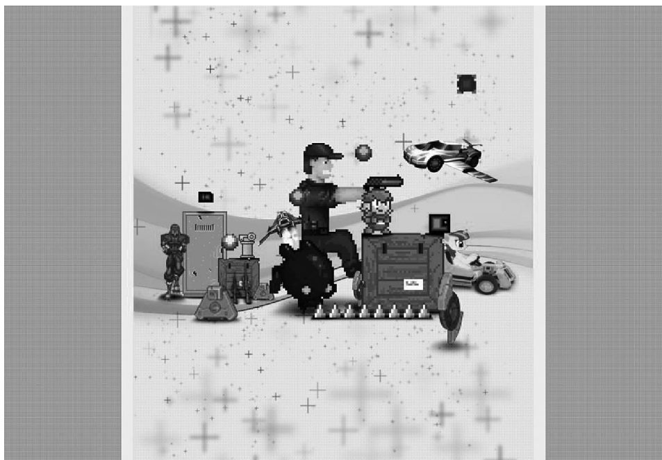
Rys. 4 Okładka „Parallaxu” (nr 4)