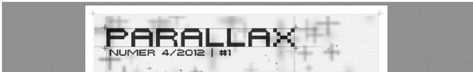
Rys. 2 Logo „Parallaxu”