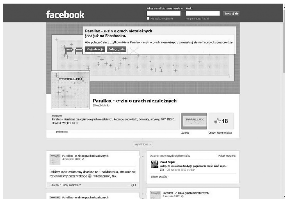
Rys. 1 Fanpage „Parallaxu” w portalu Facebook