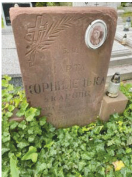
Pomnik Marty Kornyleckiej