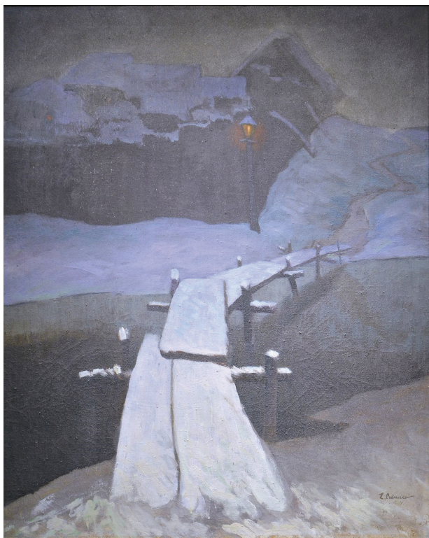
Zenobiusz Poduszko, Wieczór