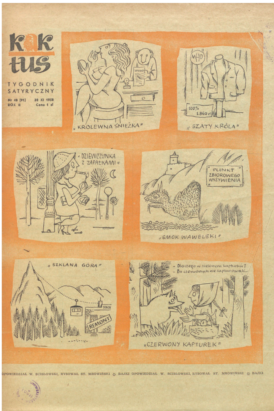
II. 1. The title page of Kaktus from 30 November 1958. It shows a fairy tale described by Włodzimierz Scisłowski and illustrated by Stanisław Mrowiński.