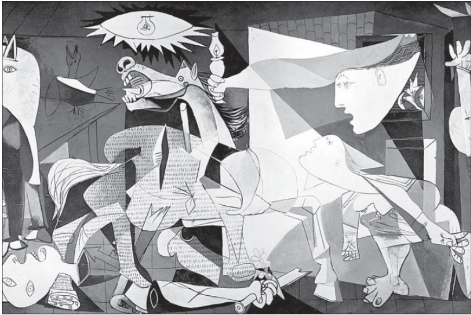
3. Pablo Picasso, Guernica , 1937, olej na płótnie, 349 x 776 cm (Muzeum Narodowe Centrum Sztuki Królowej Zofii, Madryt)

ekskluzywna atmosfera w nim panująca oraz poczucie wspólnoty dążeń i postrzeganie sztuki, której korzenie – jak chcieli personaliści – tkwią przede wszystkim w intelekcie, ale jednocześnie coraz bardziej sztuka staje się świadoma swej wolności.