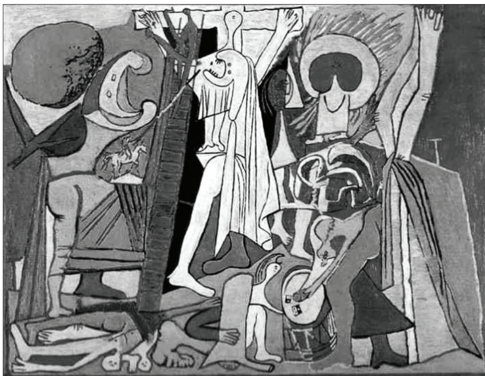
4. Pablo Picasso, Ukrzyżowanie , 1930, olej na płótnie, 65,5 x 50 cm (Muzeum Picassa, Paryż)

jednostki, jej wolności i odpowiedzialności oraz przynależnych jej niezwykłych prawach 23 . Przekonanie, że każdy akt twórczy jest aktem indywidualnym, intymnym, dzięki któremu i poprzez który dzieło sztuki – jako owoc owego aktu – pozwala włączyć się artyście/jednostce w świat innych osób, znajdowało odzwierciedlenie w życiu i sztuce artystów spotykających się w Meudon.