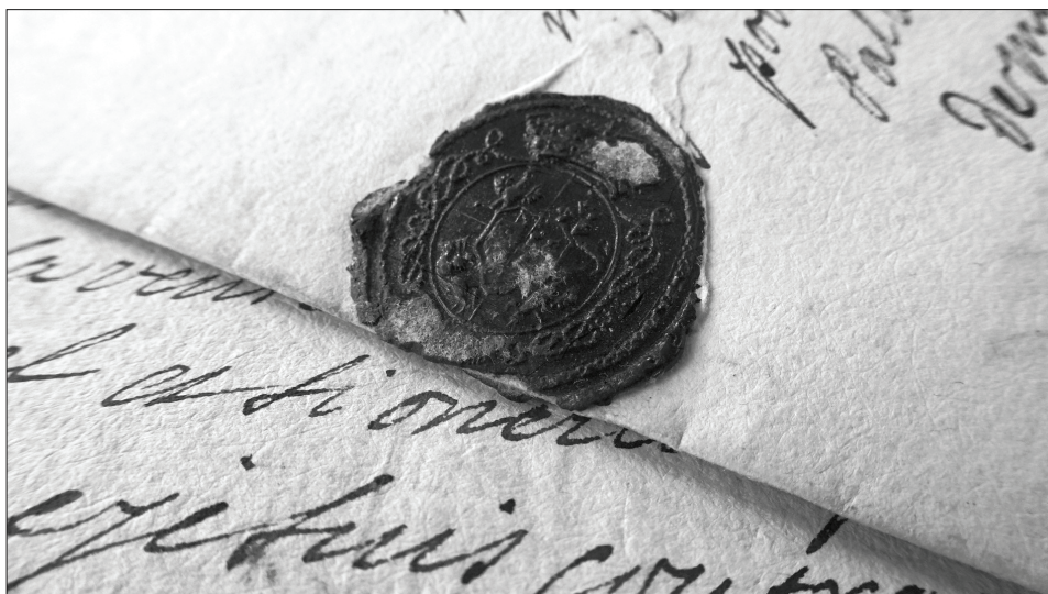
1. Pieczęć Marii Kazimiery d'Arquien Sobieskiej w liście do nieznanego adresata, Blois 17 XII 1714, Biblioteka Książąt Czartoryskich w Krakowie sygn. 2190/IV, list nr 24276

księżnych, m.in. Izabeli Stuart (1425 lub 1427–1494), żony Franciszka I, Franciszki z Amboise (1427–1485), żony Piotra II, oraz Małgorzaty Bretońskiej (1443–1469) i Małgorzaty z Foix (po 1458–1486) – dwóch żon Franciszka II 19 . Sznur zaczął też występować na monetach bretońskich w latach 1458–1488 i w wystroju rzeźbiarskim katedry św. św. Piotra i Pawła w Nantes oraz kościoła w Fougères 20 . Dodajmy tylko, że obaj władcy: Franciszek I i Franciszek II przedstawiani byli za pośrednictwem sztuk plastycznych w pozie orantów z towarzyszącym im świętym patronem 21 .