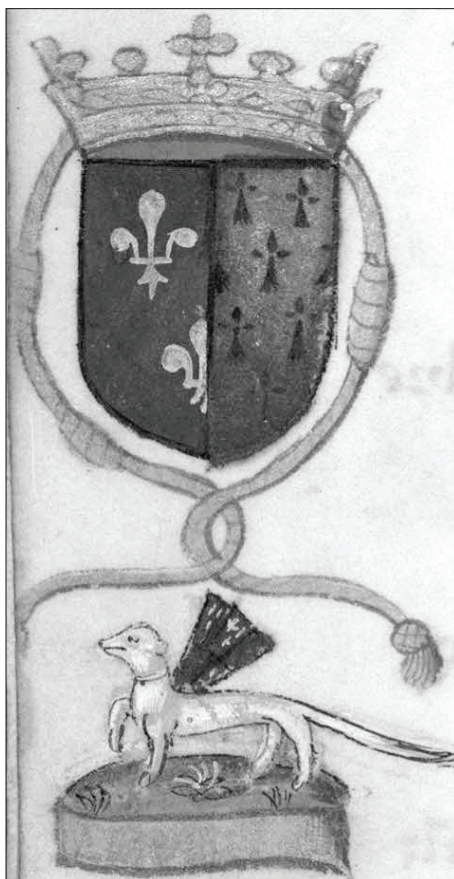
2. Herb Anny Bretońskiej ze sznurem wdowim, Bibliothèque de Rennes Ms 0332, f. 56v

matem oznaczającym królową 26 , w odróżnieniu od jelenia, jedno- różca lub krzyża jerozolimskiego – emblematów Karola VIII i jezo- zwierza symbolizującego Ludwika XII 27 . Sznur ( la cordelière ) na- brał znaczenia symbolu wyrażającego zwierzchność Anny nad jej bretońskim władztwem 28 . Właścicielka chciała wskazać na swe pochodzenie z dynastii Monfort oraz podkreślić legalność i niez- bywalność swych praw do Bretanii, zarówno wobec obu mężów, jak i względem pretendentów do tronu bretońskiego z rodów de Rohan, de Penthièvre, de Rieux i de Châtillon-Brosse. Anna eks- ponowała sznur nie tylko na pieczęciach, lecz także na mone- tach, medalach, biżuterii oraz w elementach wystroju wnętrz, jak tapiserie ścienne 29 . Zauważyć zatem należy, że sznur, obecny początkowo w heraldyce bretońskiej, w początku XVI w. przenik- nął za sprawą Anny Bretońskiej do heraldyki francuskiej.