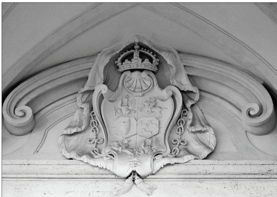
4. Herb Marii Kazimiery d'Arquien Sobieskiej na fasadzie Palazzo Zuccari w Rzymie, proj. F. Juvarra, 1704–1714 r. (fotografia w zbiorach Autora)