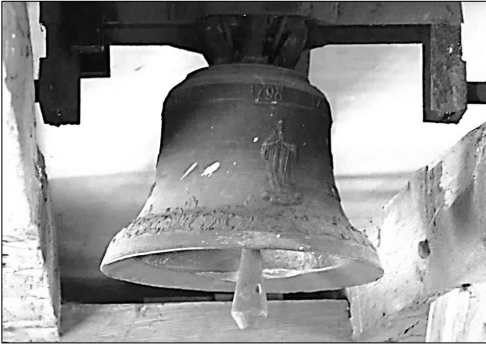
13. Dzwon Piotra Weidnera w wolno stojącej dzwonnicy przy kościele parafialnym w Rembieszycach, 1798 r.