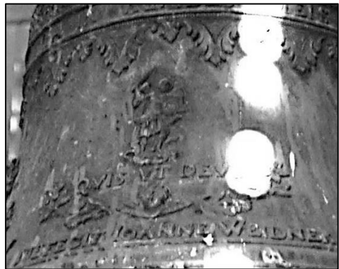
12. Dzwon w Złotnikach z 1757 r., fragment dekoracji płaszcza z plakietką św. Michała Archaniola i sygnaturką ludwisarza