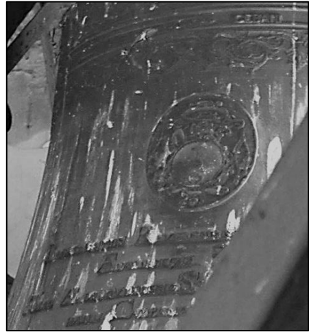
8. Herb Złota Wolność na dzwonie z Jędrzejowa, 1768 r.