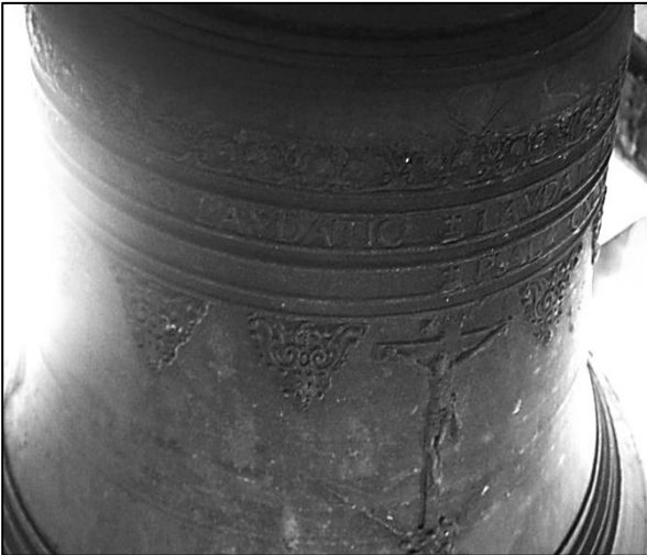
2. Fragment inskrypcji i dekoracji na dużym dzwonie z kościoła parafialnego w Małogoszczu z 1655 r.