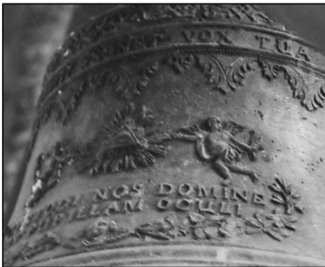
11. Plakietka z wyobrażeniem Oka Opatrzności podtrzymanym przez dwa anioły na dzwonie J.Z. Weidnera w Złotnikach, 1757 r.