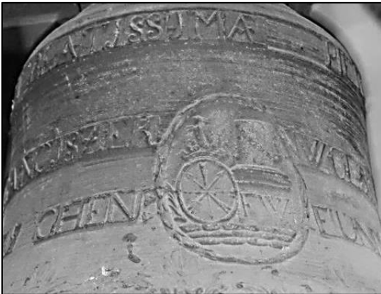
14. Plakietka z herbem Jelita na dzwonie w Rembieszycach, 1798 r.