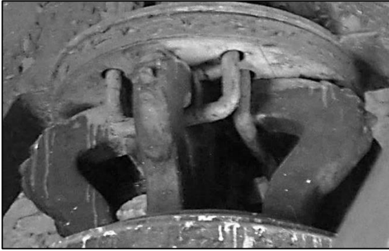
9. Kościół cystersów w Jędrzejowie, dzwon Ernesta Fryderyka Kocha, 1768 r., dekoracja kabłąków korony

mają też znaną z wielu prac sentencję biblijną: „SOLI DEO GLORIA”, datę odlewu oraz sygnaturkę ludwisarską. Na starszym z dzwonów imiona mistrza zostały zapisane tylko w formie inicjałów. Poza tym wyróżnia go plakietka z wizerunkiem Matki Boskiej umieszczona na płaszczu. Drugi zabytek dekoruje przedstawienie Oka Opatrzności 26 .