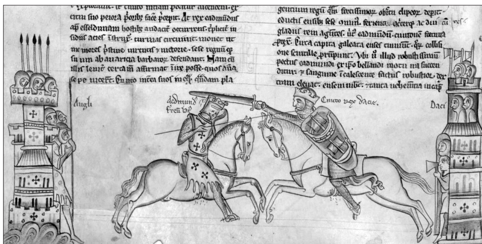
1. Pojedynek angielskiego króla Edmunda II Żelaznobokiego z władcą duńskim Kanutem Wielkim (Mateusz z Paryża, Historia Anglorum, XIII w.,)

z kroniki Mateusza z Paryża (il. 1). Druga natomiast to wyimaginowany pojedynek Ryszarda Lwie Serce z Saladynem (angielski rękopis z ok. 1340 r., il. 2).