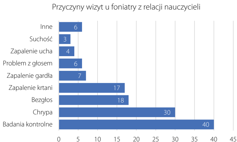
Wykres 2. Przyczyny wizyt u foniatry z relacji nauczycieli