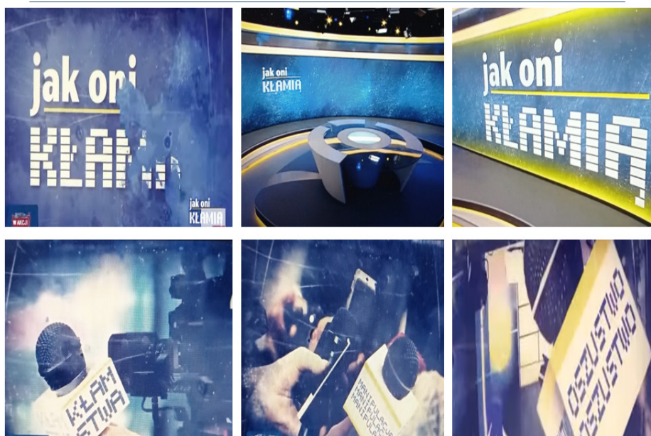
Fot. 1. Wybrane kadry programu Jak oni kłamią

Zanim jednak poruszę tytułowe zagadnienie, wspomnę jeszcze o oprawie wizualnej programu TVP Info, tym bardziej że w telewizji środkami wyrazu są nie tylko słowa, ale i obrazy oraz efekty dźwiękowe, które współtworzą nastrój komunikatu medialnego i usposabiają telewidza emocjonalnie do nadawcy, do przekazu, do przedstawianych osób, problemów oraz wydarzeń (Michalewski 2004: 190). Została ona rozmyślnie zaprojektowana w taki sposób, aby w swojej formule do złudzenia przypominać dziennik Fakty . Co ciekawe, w sieci pojawiły się głosy, że równie dobrze ów magazyn mógłby nosić tytuł Jak oni kopiają (zob. Łupak 2023). Uderzające podobieństwo do grafiki Faktów unaoczniają poniższe zdjęcia (por. fot. 1) 3 :