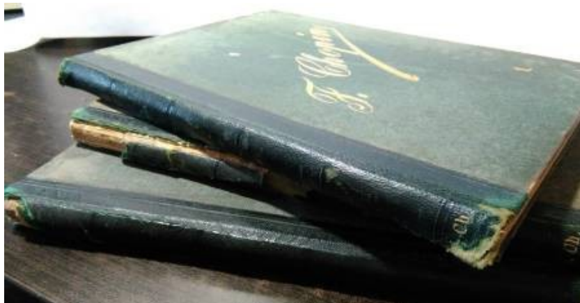
Fot. 10b. Grzbiety trzech tomów F. Chopin, Oeuvres pour le Piano , vol. 1–3 ([1877])