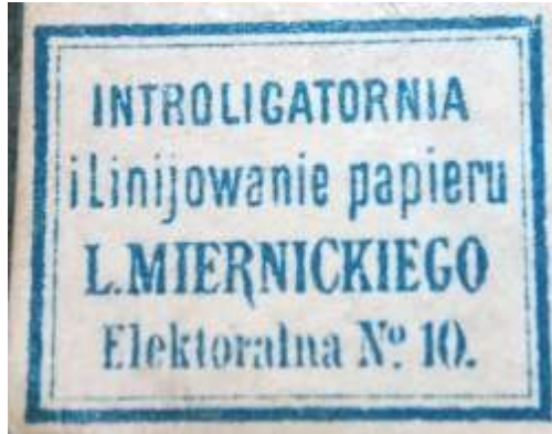
Fot. 9. Ekslibris „Introligatornia i Linijowanie Papieru L. Miernickiego, Elektoralna 10” (oryginalne wymiary: 20x17 mm) (Chopin, [1877])