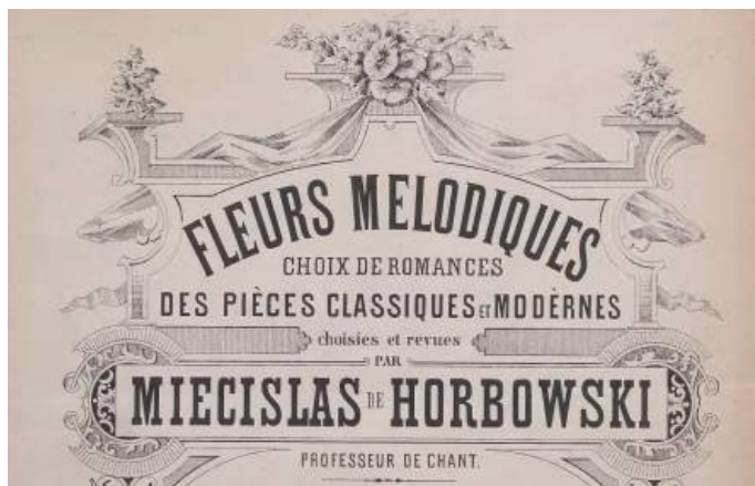
Fot. 6a i 6b. Przykład nazwy serii w zakładzie Kruziński et Lewi oraz stopka adresowa wydawcy (Moszkowski, cenz. 1883)