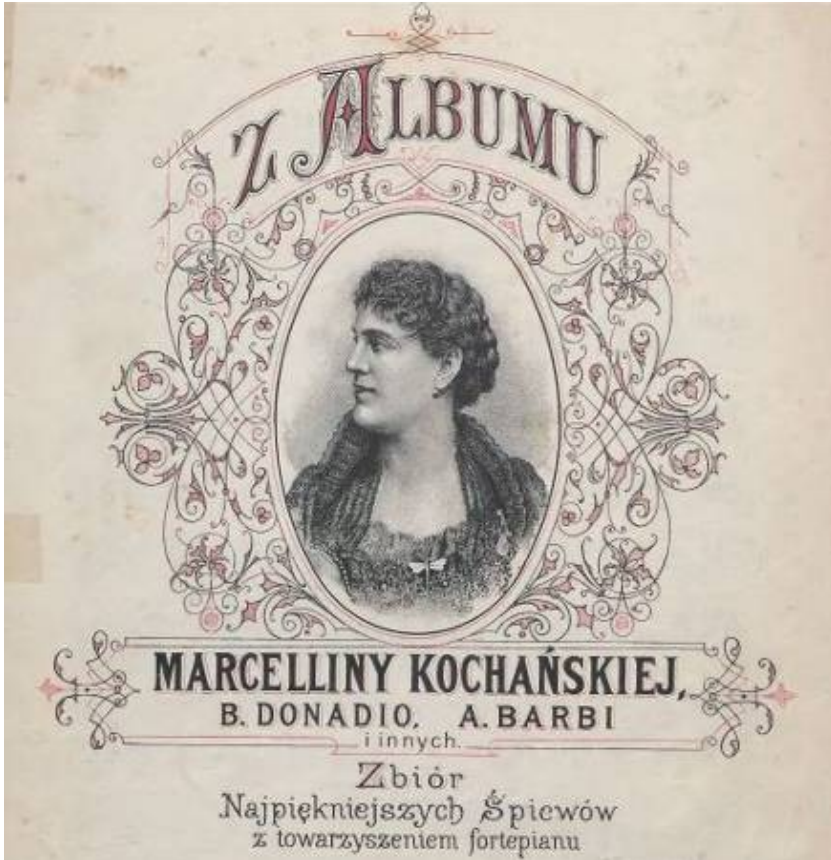
Fot. 3. Przykład zapisu serii Z Albumu Marcelliny Kochańskiej ... wraz z ilustracją (Massenet, [około 1895])