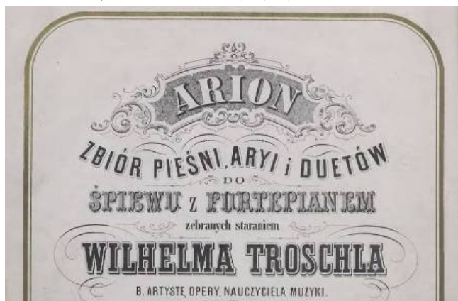
Fot. 4. Przykład serii Arion (...) , (Kücken, cenz. 1882)