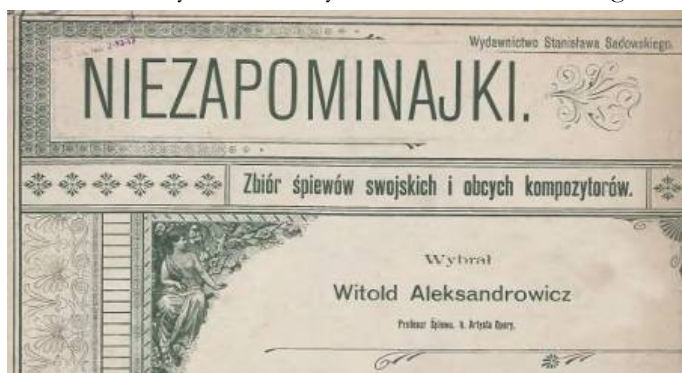
Fot. 7. Przykład serii Wydawnictwa S. Sadowskiego