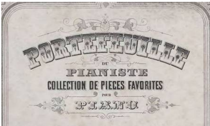
Fot. 8. Przykład serii dla pianistów