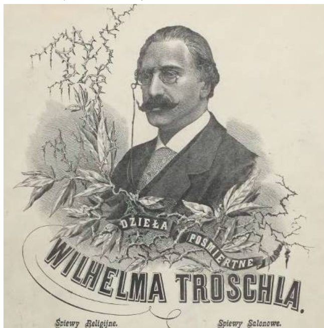
Fot. 5. Przykład serii Dzieła Pośmiertne Wilhelma Troschla