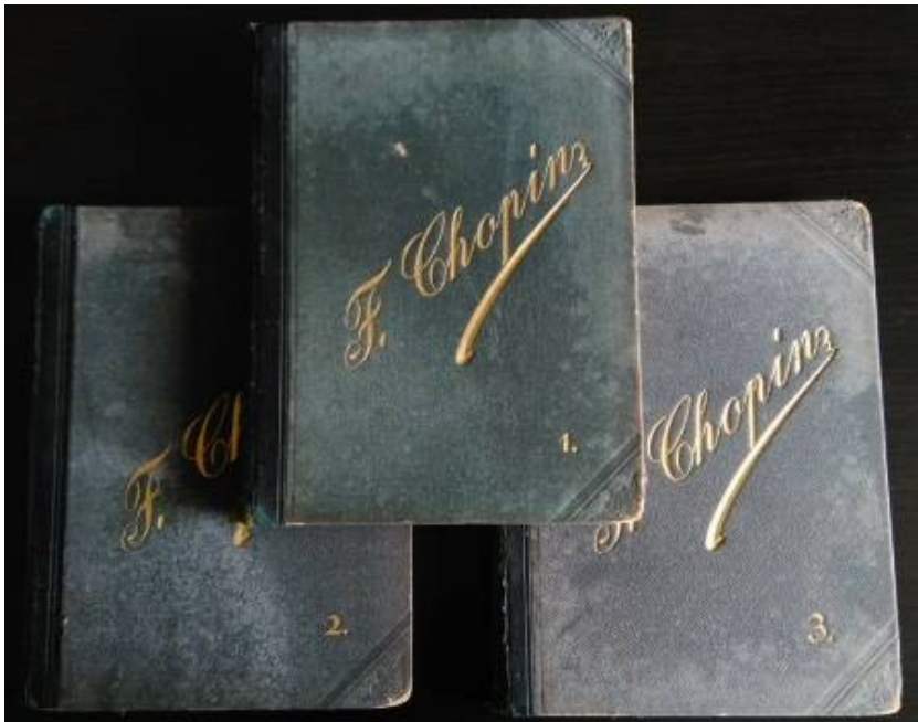
Fot. 10a. Okładki trzech tomów F. Chopin, Oeuvres pour le Piano , vol. 1–3 ([1877])