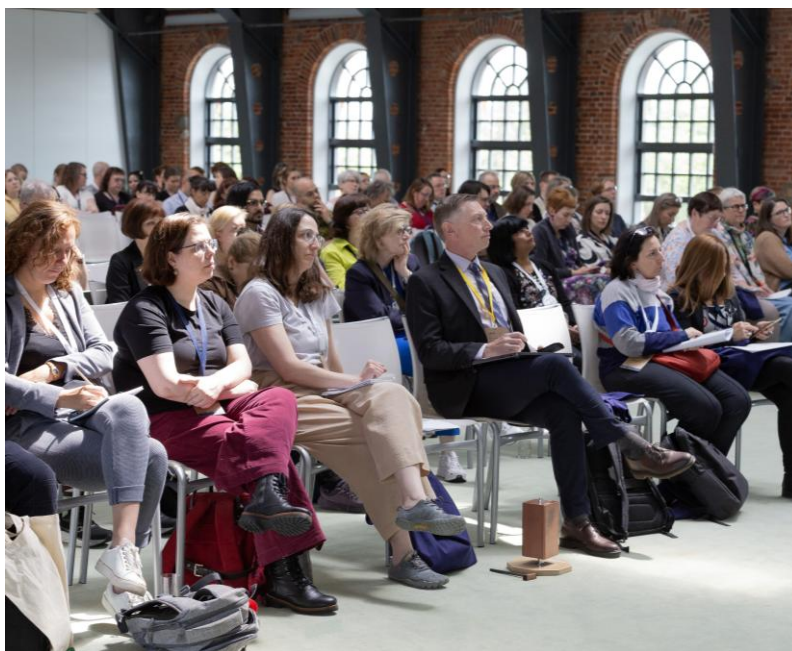
Ilustracja 2. Prezentacja w sali konferencyjnej Ballroom Vienna House Andel's