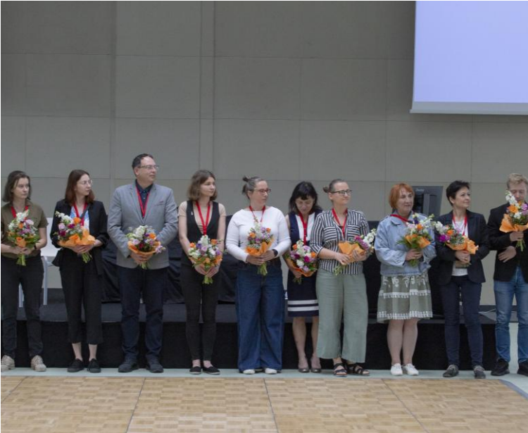
Ilustracja 5. Ostatni dzień konferencji; podziękowania dla uczestników i organizatorów wydarzenia