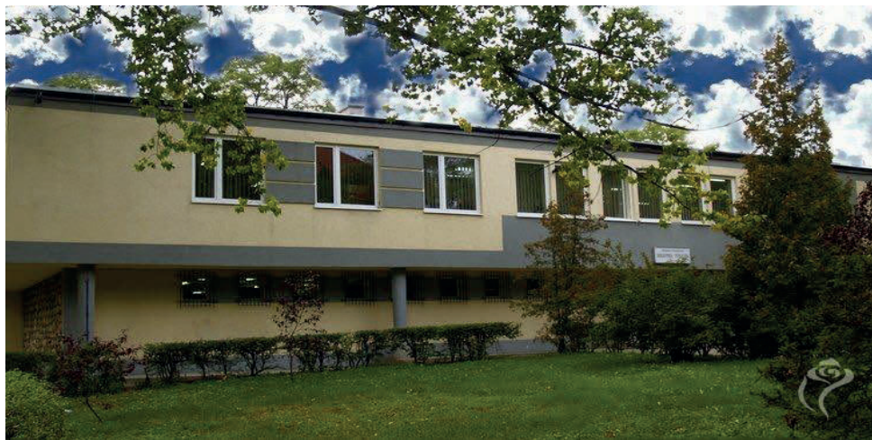
Ilustracja 2. . Gmach siedziby Miejskiej i Powiatowej Biblioteki Publicznej w Kutnie współcześnie