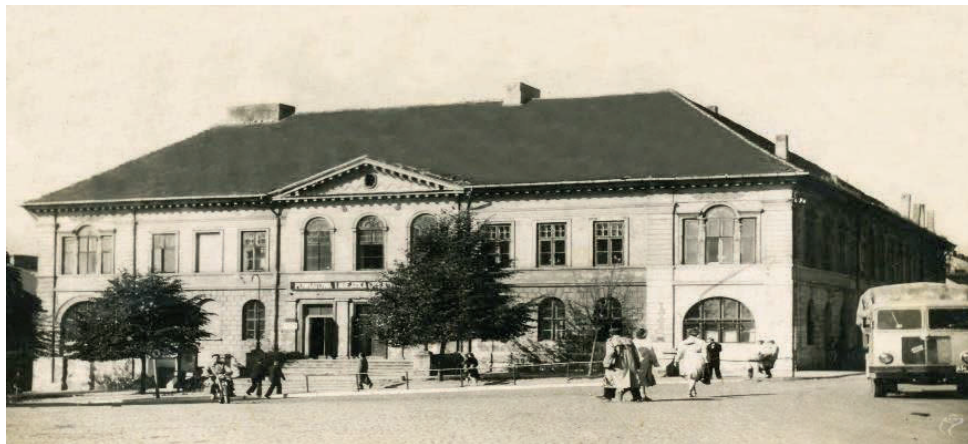
Ilustracja 1. Gmach siedziby Miejskiej i Powiatowej Biblioteki Publicznej w Kutnie w latach 50. i 60. XX w.