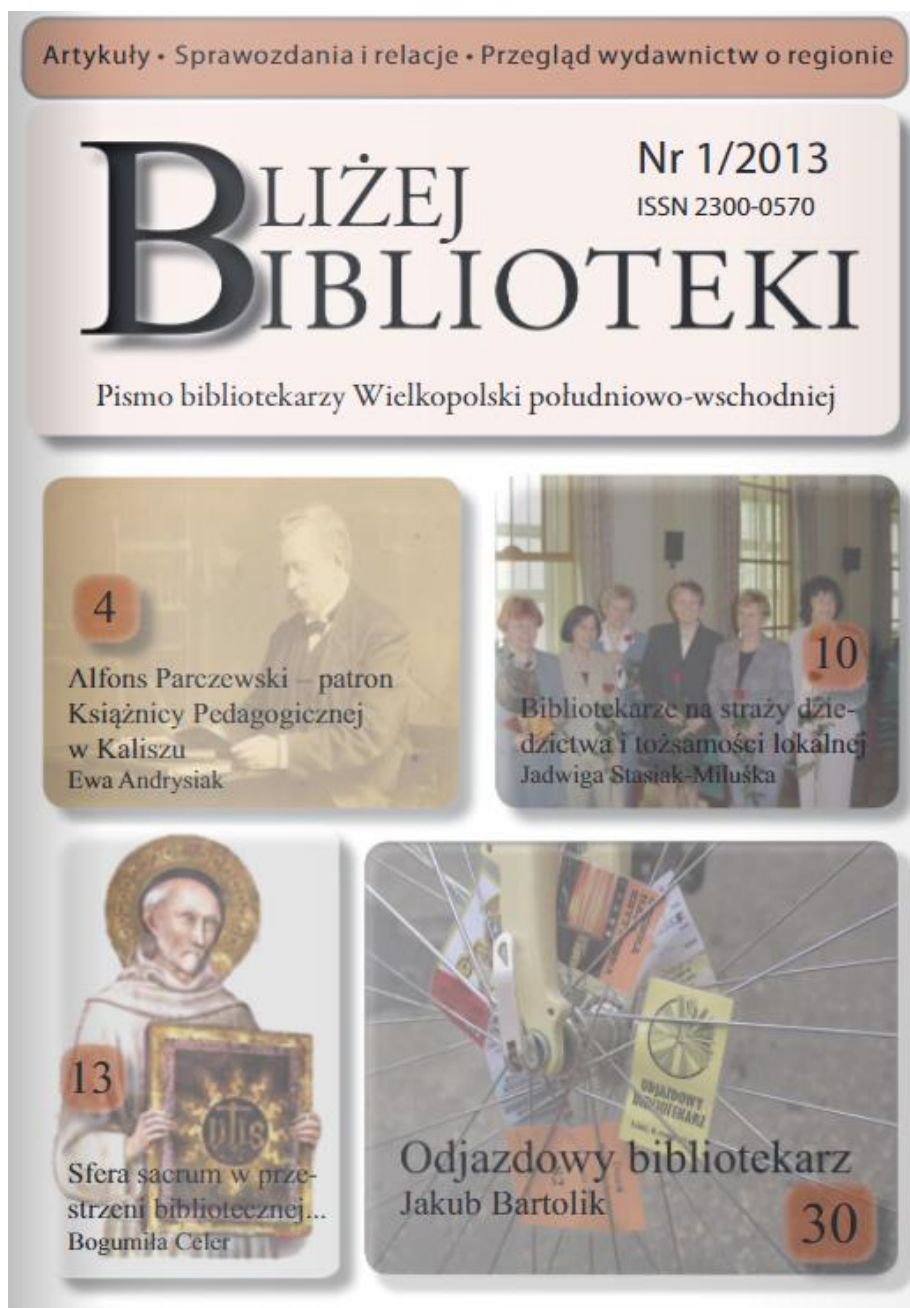
Ryc. 4. Okładka pierwszego numeru czasopisma