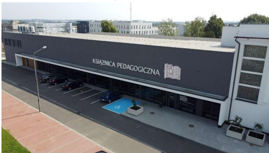
Ryc. 3. Siedziba PBP Książnicy Pedagogicznej im. A. Parczewskiego w Kaliszu, ul. Południowa 62