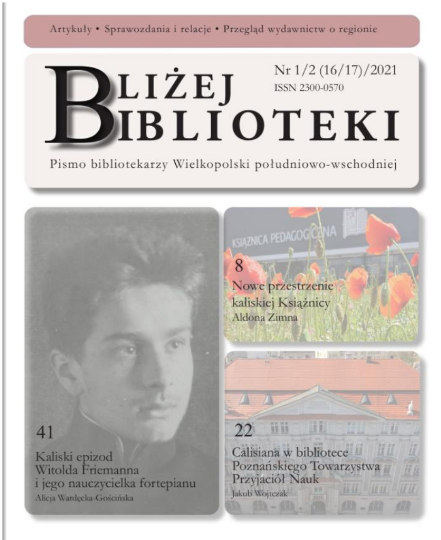
Ryc. 5. Okładka czasopisma z 2021 roku