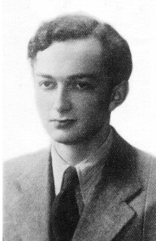
Ryc. 1. Janusz Teodor Dybowski przed wojną.