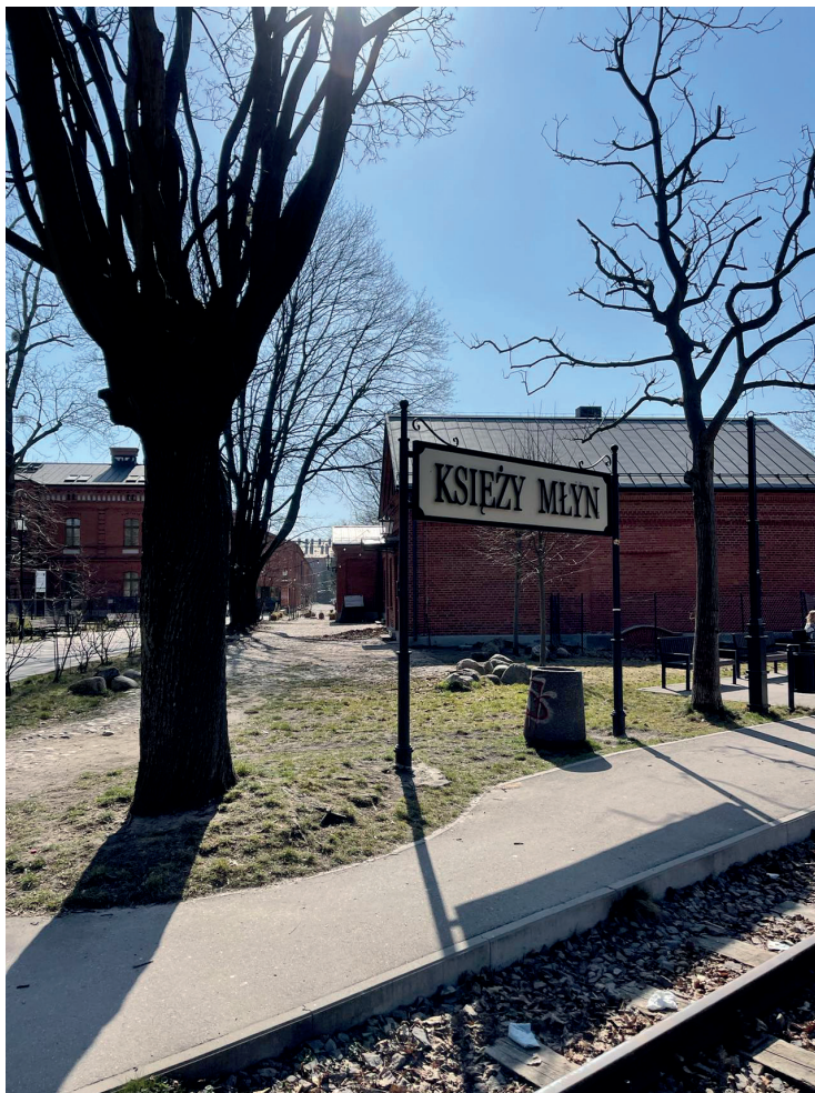
Fotografia 1. Księży Młyn