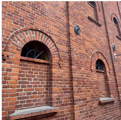
Fotografia 3. Okna dawnych magazynów