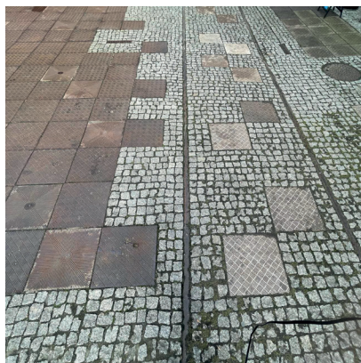
Fotografia 5. Zachowana boczna kolejowa oraz żeliwne płyty