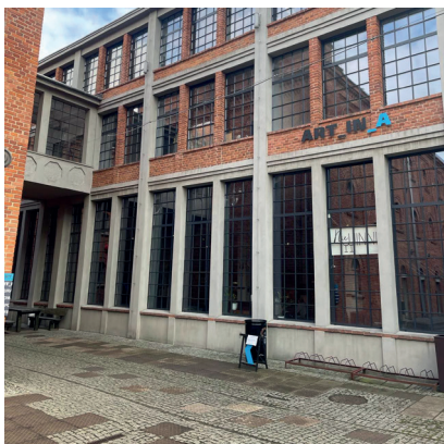
Fotografia 4. Element kompozycji budynku A – żelbetowe słupy