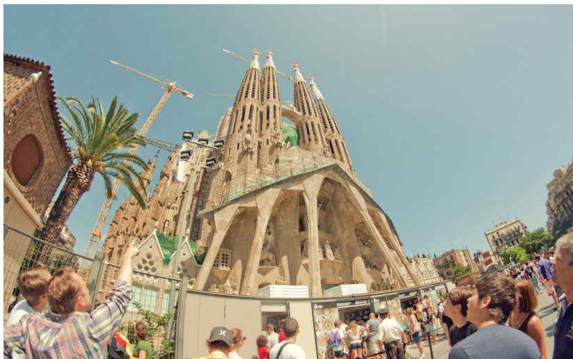
Fotografia 3. Sagrada Família w Barcelonie

wynajmowanie prywatnych mieszkań. Dodatkowym pomysłem na zmniejszenie problemu z zanieczyszczaniem dziedzictwa naturalnego jest ograniczenie liczby statków wycieczkowych (Brudny, 2021).