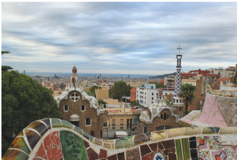
Fotografia 1. Park Güell w Barcelonie