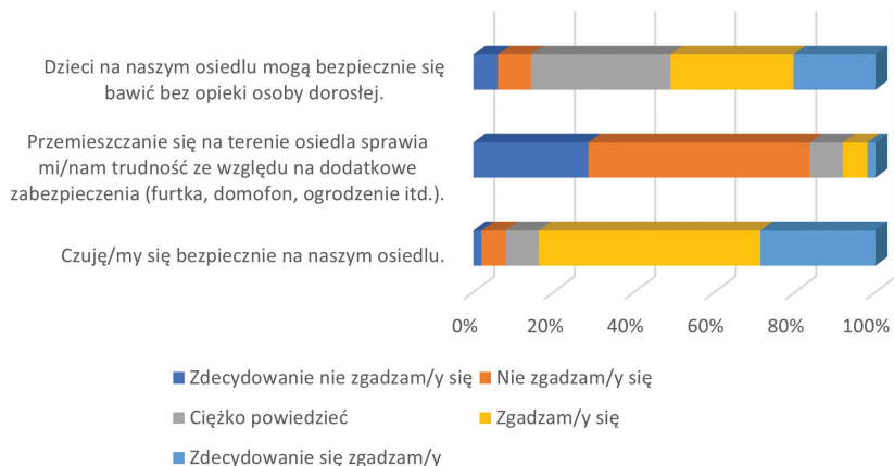
Wykres 2. Opinia respondentów w kwestii poczucia bezpieczeństwa na terenie osiedla [proc.]