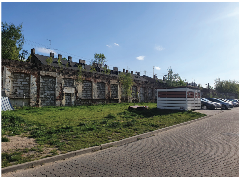
Fotografia 2. Bariera przestrzenna – pofabryczny mur przy głównym wejściu na osiedle

Osiedle to wybrano do analizy ze względu na kilka cech, które czynią to osiedle bliskim osiedlom grodzonym: stary pofabryczny mur pełniący funkcję elementu bezpieczeństwa oraz przynależność społeczna tego osiedla. Druga z cech objawia się jednorodnością statusu materialnego i klasy społecznej oraz stylu życia w porównaniu do mieszkańców w okolicy osiedla (Fotografia 2). Za sprawą muru, który jawi się jako bariera przestrzenna, łatwo można dostrzec różnicę między przestrzenią zamieszkiwaną przez klasę średnią (opisywane osiedle) a przestrzenią zamieszkiwaną przez klasę pracującą (stare kamienice w pobliżu). Znaczącym elementem „Nowej Przędzalni”, który również odnosi się do definicji osiedli grodzonych, są liczne znaki informujące o zakazie wjazdu osób z zewnątrz (Fotografia 3) oraz o monitoringu i szlabanie na wjeździe do parkingu osiedla (Fotografia 4). Miejsce to nie jest w pełni osiedlem grodzonym ze względu na niekontrolowaną możliwość wejścia przechodniów na teren „Nowej Przędzalni”. Brak jest głównej furtki z domofonem, która pozwoliłaby na weryfikację osób odwiedzających to osiedle. Właśnie ta cecha jest istotna dla badania, gdyż nie wiadomo, czy nie w pełni grodzone osiedle mogłyby mieć tendencję do pogłębiającego się procesu grodzenia.