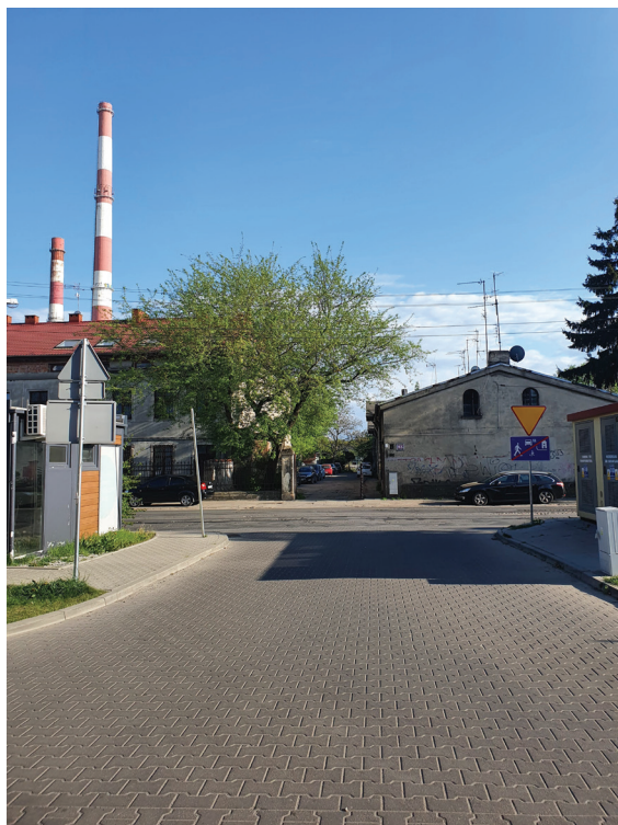
Fotografia 5. Widok z wyjazdu z osiedla Nowa Przędzalnia

willa Leona Allarta. Obok niej znajdują się stare, zaniedbane kamienice mieszkalne. Elementy te sprawiały, że respondenci czuli się za bramą osiedla niebezpiecznie po zmroku. Obawy przed poruszaniem się poza terenem osiedla, do którego każdy ma dostęp sprawiały, że mieszkańcy chcieliby zwiększyć kontrolę nad tym, kto odwiedza ich miejsce zamieszkania.