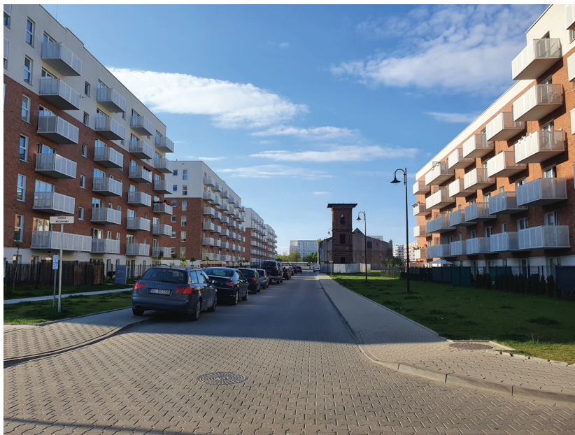
Fotografia 1. Osiedle Nowa Przędzalnia

Jednym z największych osiedli na terenie Łodzi, które przejawia wybrane cechy osiedli grodzonych, jest osiedle „Nowa Przędzalnia” przy ulicy Wróblewskiego (Fotografia 1). Jest to ogromny kompleks mieszkaniowy liczący 819 lokali. Inwestor – firma Murapol – w roku 2022 rozpoczął kolejne budowy trzynastego i czternastego budynku, które uzupełnią to osiedle (Murapol, 2022).