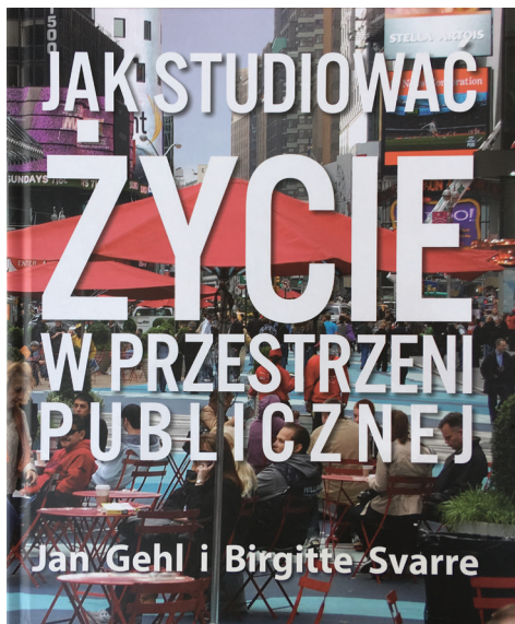
Rysunek 1. Okładka książki

Słowa kluczowe: przestrzeń publiczna, studiowanie, życie miejskie, miasto