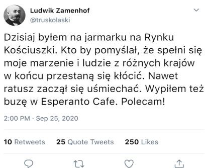
Zdjęcie 1. Załącznik nr 1