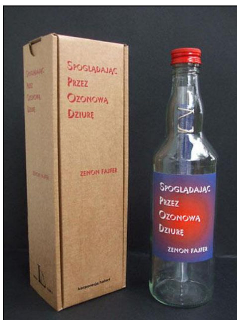
Ilustracja 1. Z. Fajfer, Spoglądając przez ozonową dziurę (2004)

Cielesność i związana z nią pełnia utworu liberackiego jest szczególnie wyraźnie widoczna w stworzonym i opublikowanym przez Fajferę w 2004 r. utworze w formie butelki (mającym własny numer ISBN!) Spoglądając przez ozonową dziurę [Fajfer 2004]. Dzieło posiada cielesną formę butelki, która nie jest jednak pustym semantycznie pojemnikiem na tekst, lecz kluczowym elementem, który należy interpretować w ścisłym związku z pozostałymi częściami utworu (w tym także z zawartym wewnątrz wierszem, który również charakteryzuje się specyficznym ułożeniem architektonicznym).