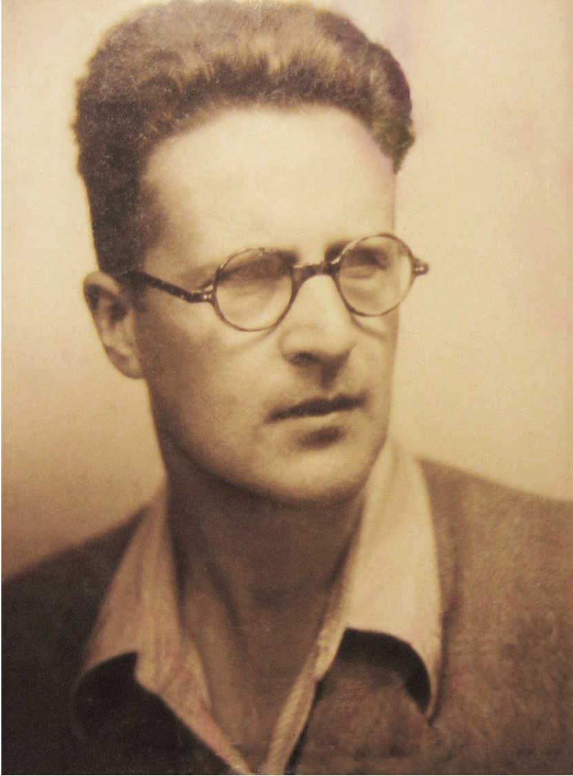
8. W. Kula w łódzkim okresie życia (1947)