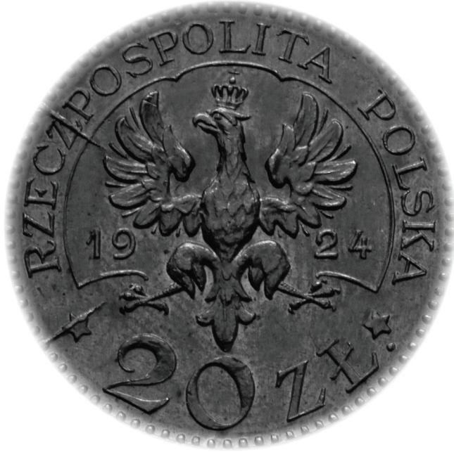
5. Orzeł Tadeusza Załuskiego (1924 r.)