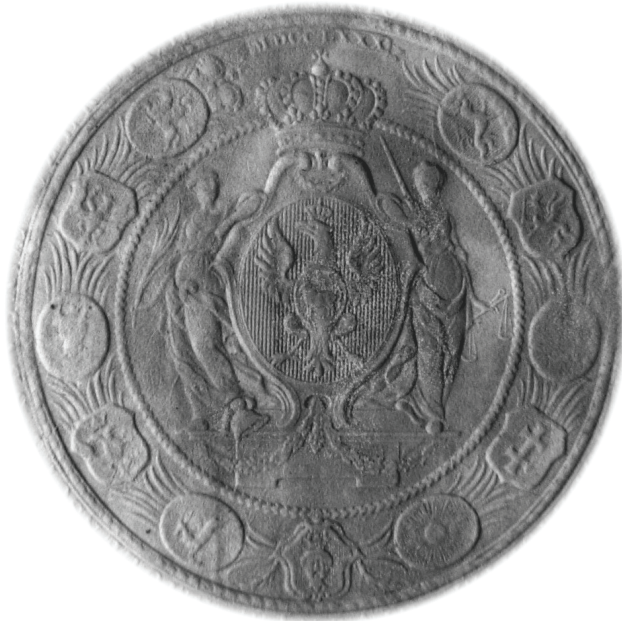
10. Zespół herbów z pieczęci wielkiej koronnej Stanisława Augusta Poniatowskiego (1780 r.)