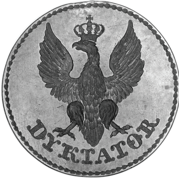
13. Pieczęć Dyktatora powstania listopadowego (1830 r.)