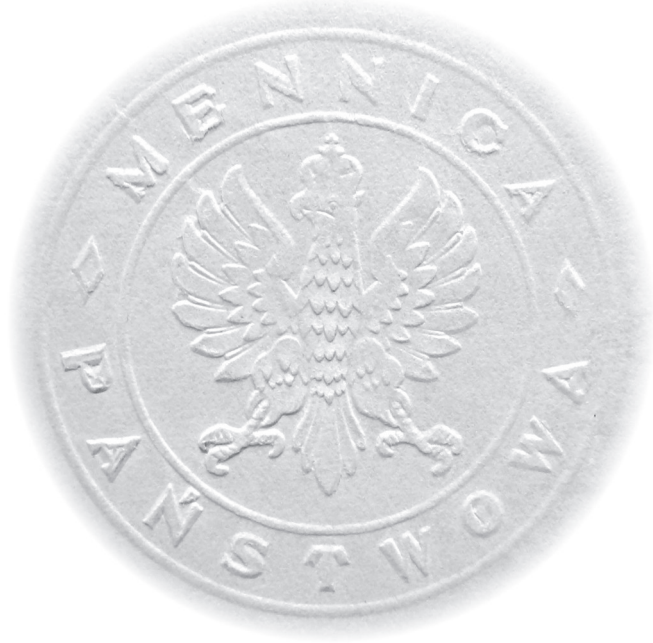
9. „Prototyp” pieczęci ze wzorem nowego polskiego orła państwowego (1924 r.)