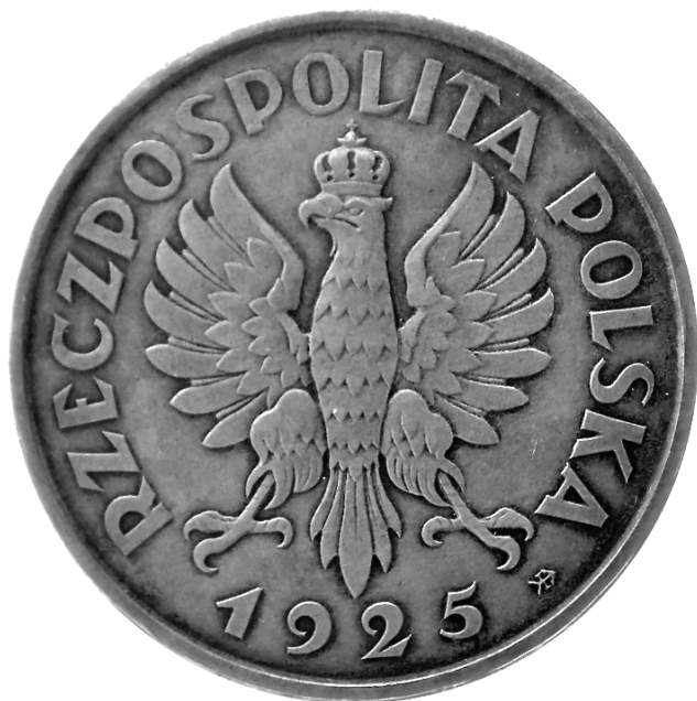
8. Orzeł Stanisława Lewandowskiego (1925 r.)