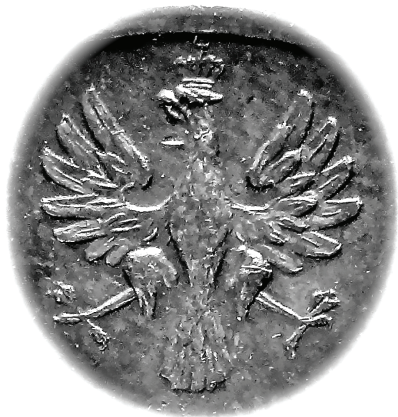
3. Orzeł Władysława Wasiewicza (1922 r.)