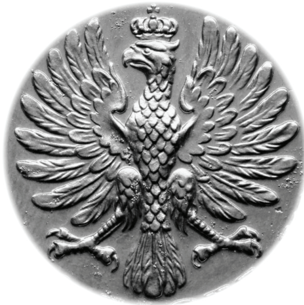
6. Orzeł Walerego Amrogowicza (1928 r.)