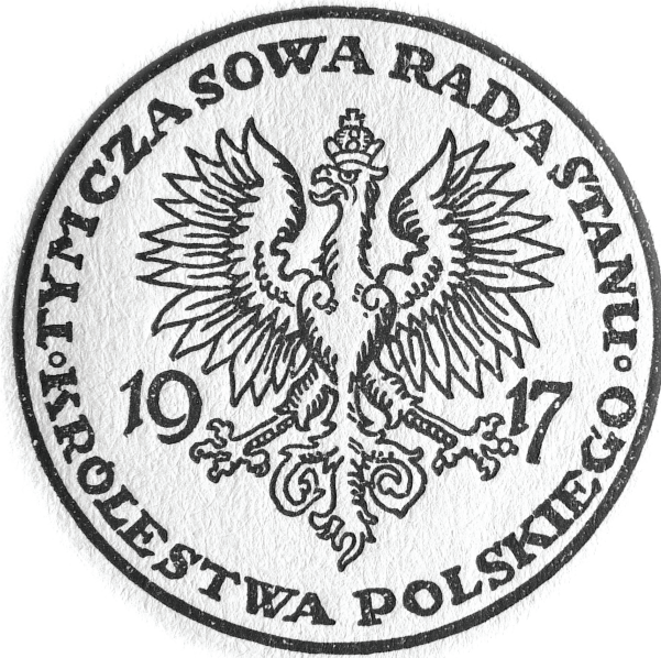
1. Pieczęć Tymczasowej Rady Stanu (styczeń 1917 r.)