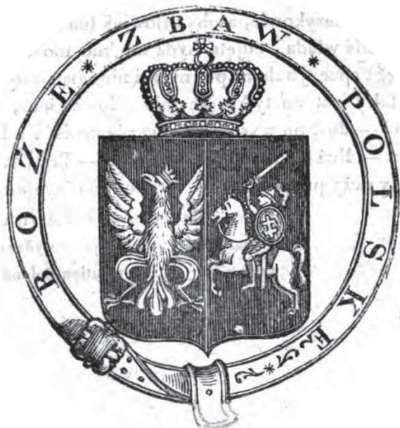
15. Herb z okresu powstania listopadowego w publikacji emigracyjnej