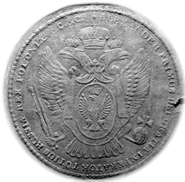
11. Pieczęć Aleksandra I, króla Polski (1815 r.)