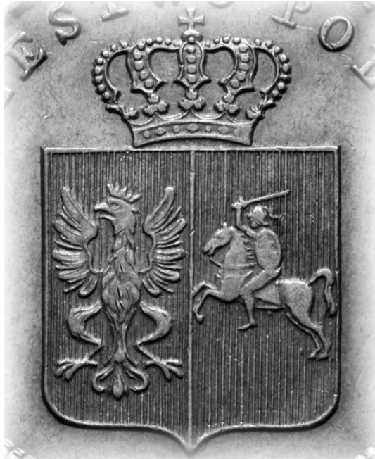
14. Herb z okresu powstania listopadowego na monecie złotowej (1831 r.)