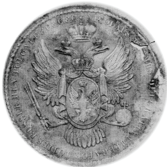
12. Pieczęć Mikołaja I, króla Polski (1825 r.)