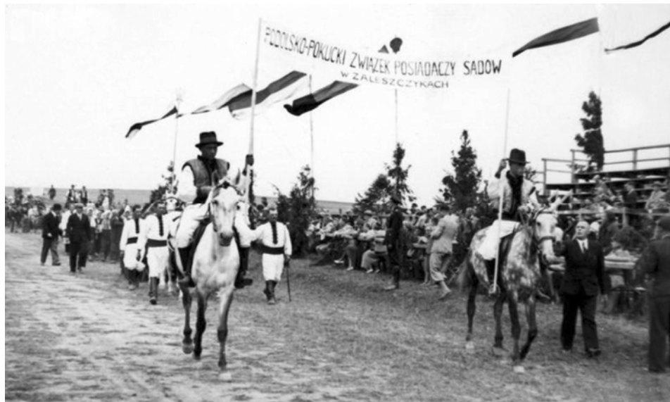
Ryc. 7. Zaleszczyki, „Dożynki winne”, 1937 r., banderia Podolsko-Pokuckiego Związku Posiadaczy Sądów