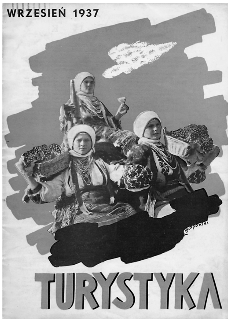
Ryc. 11. Okładka pisma „Turystyka” z września 1937 r.