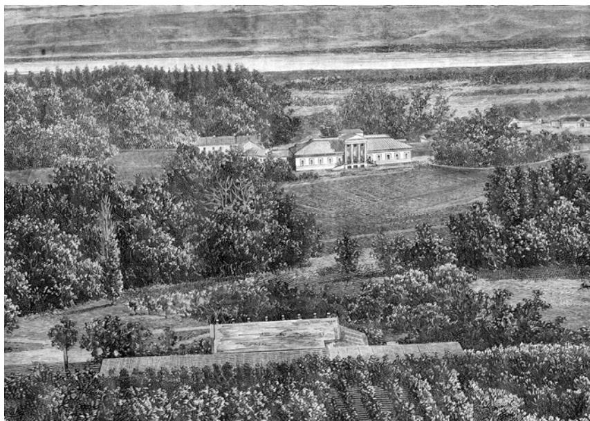
Ryc. 1. Winnice w Kamionce księcia Piotra Wittgensteina, drzeworyt z 2. poł. XIX w.