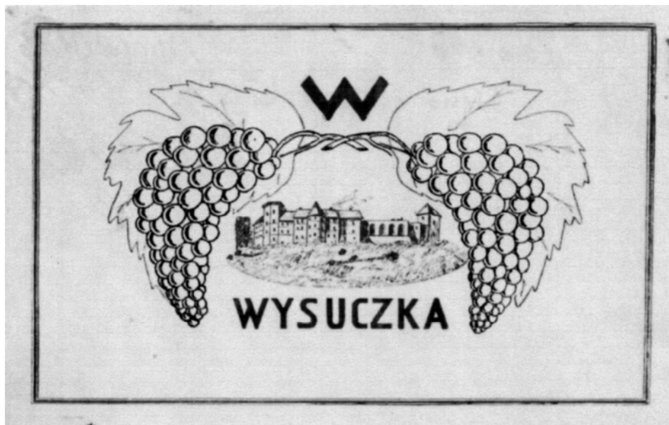
Ryc. 9. Nalepka wina z Ordynacji Wysuczka z rysunkiem zamku, u stóp którego założono pierwsze winnice ordynacji