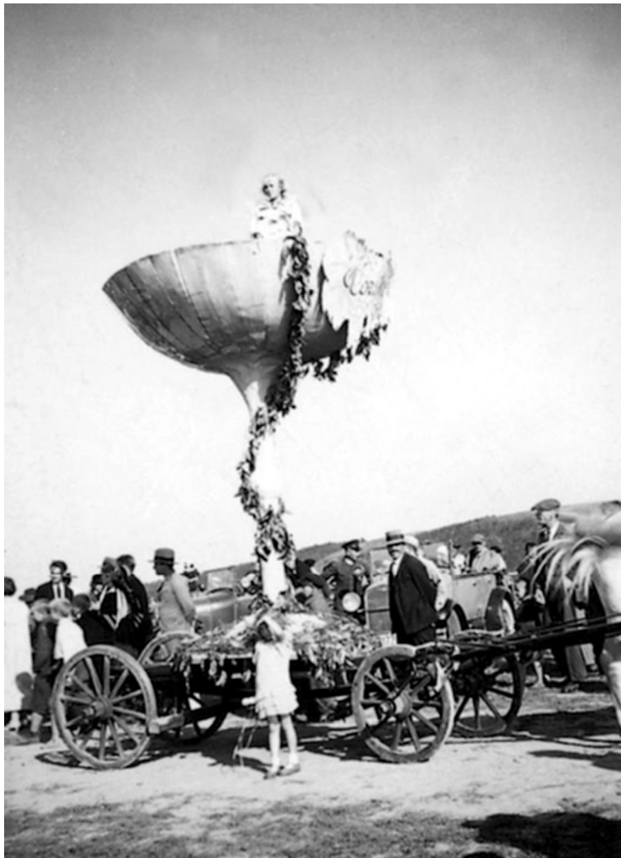
Ryc. 6. Nagrodzony wóz dożynkowy Zofii Łosiowej, „Dożynki winne” w Zaleszczykach w 1935 r.