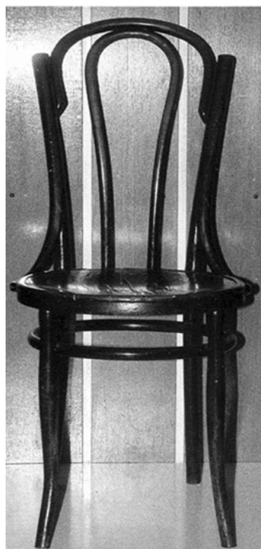
Ryc. 3. Krzesło wyprodukowane w firmie „Bracia Thonet”

Ciekawą kwestią przy przeglądaniu asortymentu fabryk mebli giętych Królestwa Polskiego jest sprawa wzornictwa. Otóż większość tych firm czerpała zarówno wzory, jak i konstrukcję swoich wyrobów z wypracowanych modeli stylistów thonetowskich. Przeglądając katalogi firmowe praktycznie nie widać