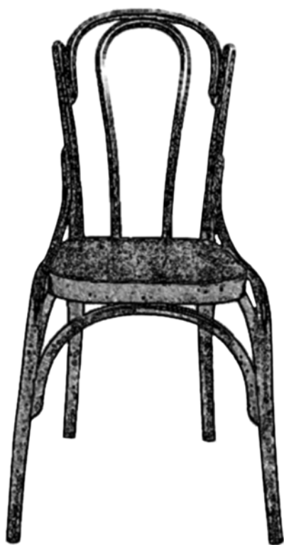
Ryc. 2. Krzesło wyprodukowane w firmie „Wojciechów” (szkic własny)

w 1903 r. 180 osób), oddział w Odessie (zatrudniał 15 robotników) i tartak „Marysin” w Tarnawatce powiat Tomaszów Lubelski (założony w 1885 r. zatrudniał w 1903 r. 25 osób). W latach 1897–1898 wypłacono 15% dywidendy, następnie w 1899 r. 12%, w 1900 r. tylko 8%, jednak już w 1901–1902 po 12%. W 1903 r. dywidendy nie wypłacono, co było spowodowane kosztami odbudowy fabryki w Kamińsku (Gomunice) 28 . Wkrótce filie znacznie przerosły macierzyste przedsiębiorstwo. W Kamińsku w 1913 r. pracowało 1400 osób, co było swoistym rekordem w przemyśle drzewnym Królestwa Polskiego 29 .