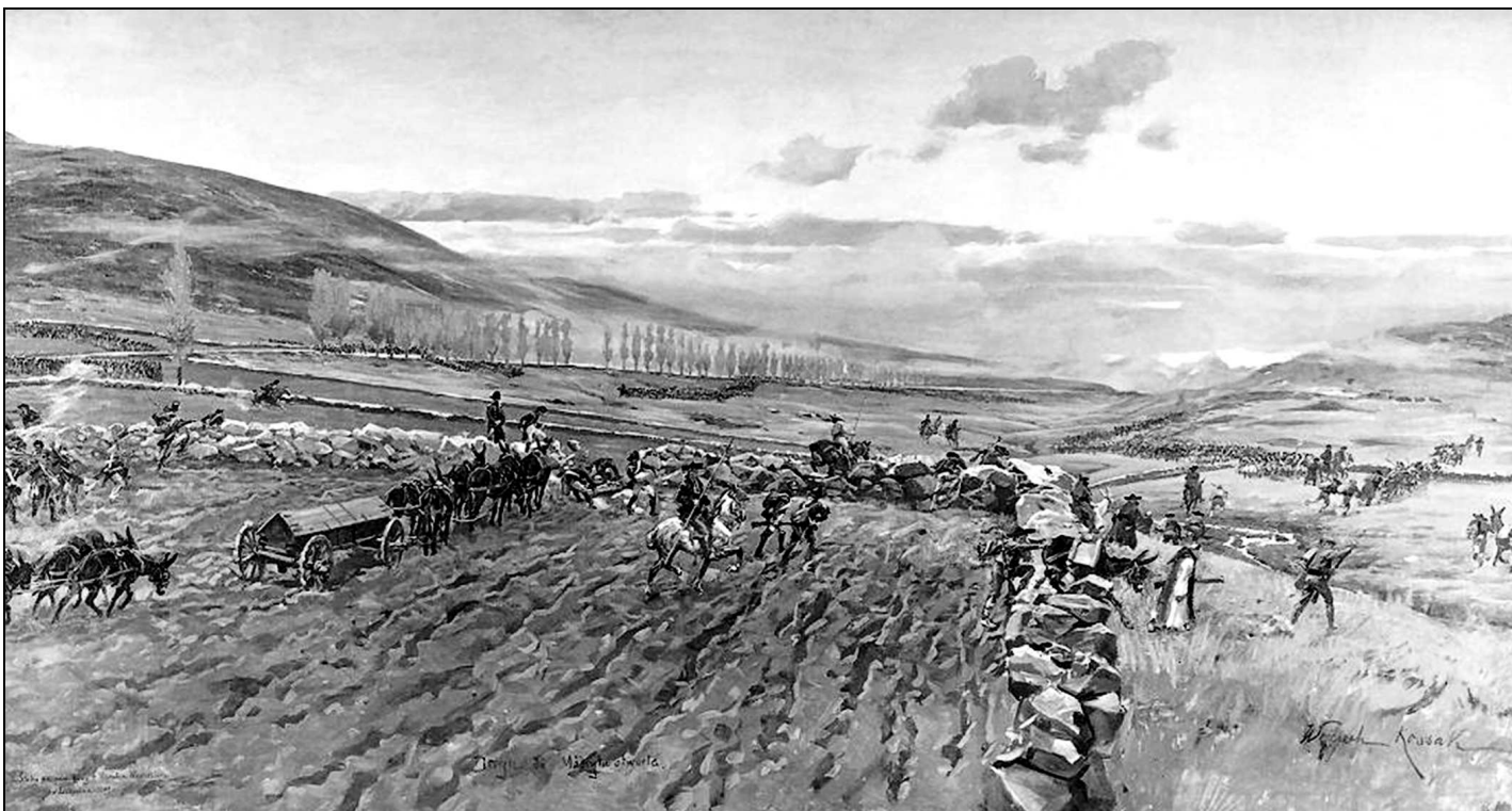
Wojciech Kossak, Michał Wywiórski Droga do Madrytu otwarta (południe) – szkic do panoramy Somosierra (1900)