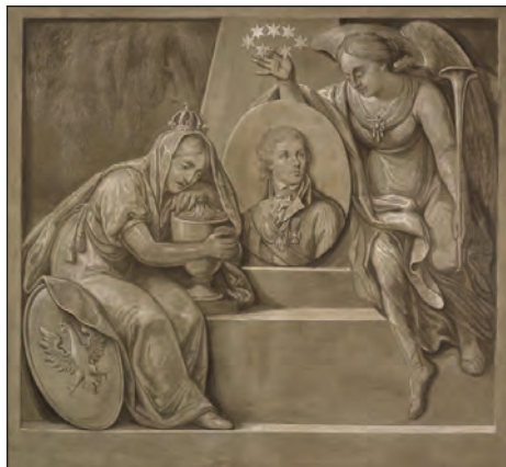
5. M. Stachowicz, Aptoteza Kościuszki , 1818, tempera na płótnie, 164 x 180 cm, Muzeum Narodowe w Krakowie

Oprócz realistycznych scen historycznych krakowski malarz tworzył także kompozycje alegoryczne o ogromnej dramaturgii. Jego obraz Kościuszko ratujący Polskę przed grobem – znany także jako Grób Ojczyzny – wyobraża ubraną na białą niewiastę uosabiającą Polskę, wpędzaną do grobu przez targowiczán, podczas gdy inni przygotowują kamienną płytę do przywalenia grobowca 23 . Uwziętienie