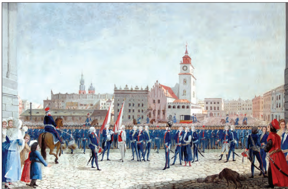
2. M. Stachowicz, Przysięga Tadeusza Kościuszki na Rynku krakowskim , 1797, gwasz, 50 x 75,5 cm, Muzeum Historyczne Miasta Krakowa