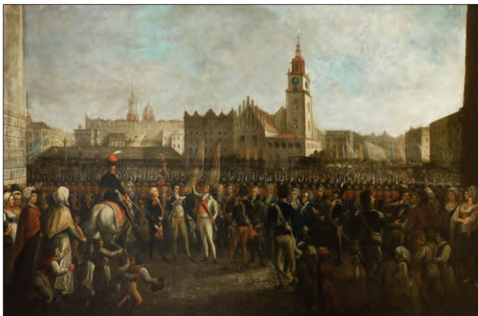
1. M. Stachowicz, Przysięga Kościuszki na Rynku Głównym w Krakowie , około 1821, olej na płótnie, 120 x 179 cm, Muzeum Narodowe w Krakowie