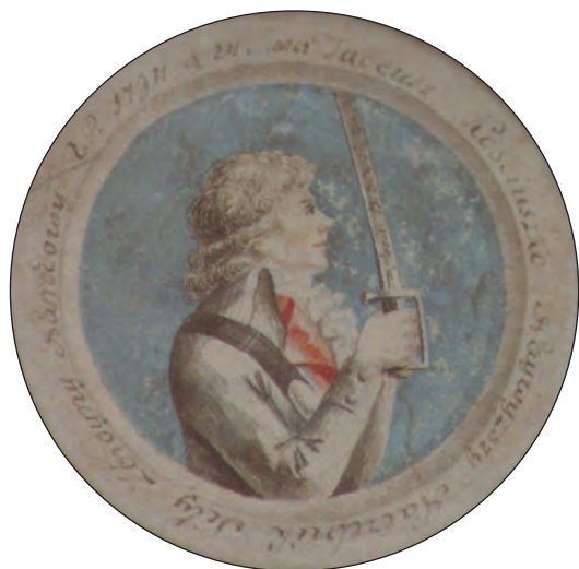
8. M. Stachowicz, portret Tadeusza Kościuszki, miniatura, Muzeum Narodowe w Krakowie