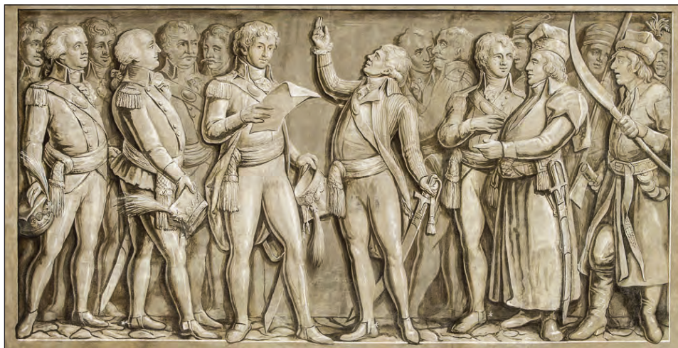
3. M. Stachowicz, Przysięga Kościuszki , 1818, tempera na płótnie, 183,5 x 300 cm, Muzeum Narodowe w Krakowie