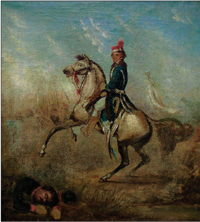
7. M. Stachowicz, Tadeusz Kościuszko na koniu , olej na płótnie, 46 x 42,5 cm, zbiory prywatne (?)

olejny (wym. 46 x 59 cm) i gwasz na papierze z około 1794 r. Obie te prace, różniące się nieznacznie układem póz i gestykulacją postaci, znajdują się w zbiorach Muzeum Narodowego w Krakowie 26 .