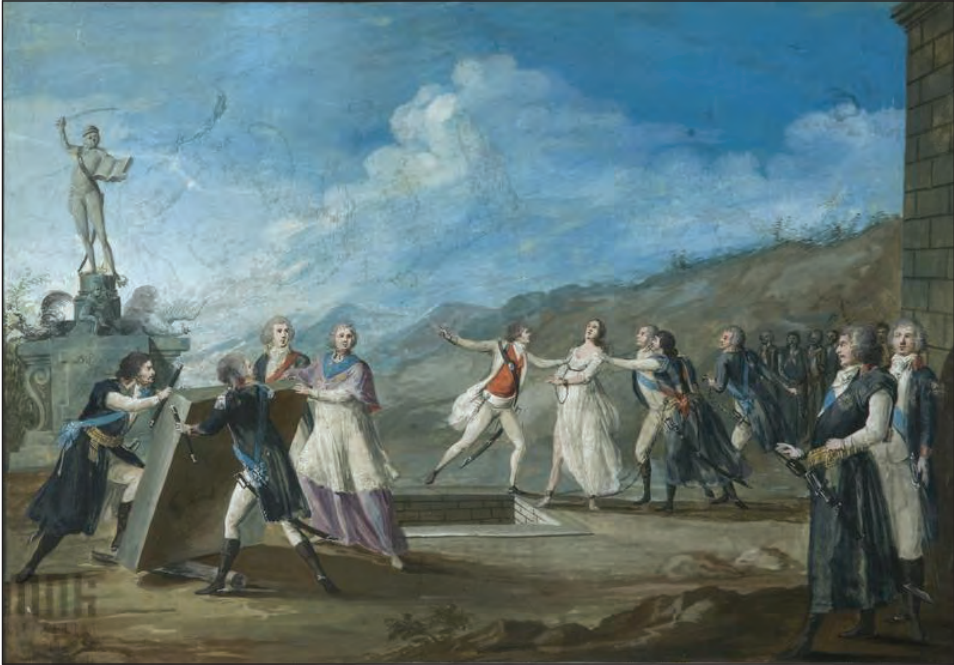
6. M. Stachowicz, Kościusko ratujący Polskę przed grobem (Grób Ojczyzny) , około 1794, 29,6 x 41 cm, Muzeum Narodowe w Krakowie

w mogile Polonii uniemożliwia Kościusko, który odpycha ją lewą dłonią, prawą zaś wskazuje na pomnik, ukazujący go w pozie Archanioła Michała 24 , z szablą uniesioną nad głową i Konstytucją 3 maja w ręce. Z piedestału pomnika spadają dwie złote korony, a anioł z opuszczoną pochodnią (symbolizującą śmierć i wojnę) spędza czarne orły mocarstw rozbiorowych: pruskiego i dwugłowego rosyjskiego 25 . Zachowały się dwie wersje tego tematu: niedatowany obraz