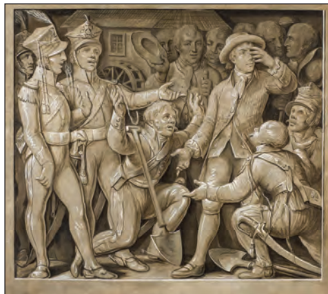
4. M. Stachowicz, Kościuszko wśród legionistów polskich we Francji , 1818, tempera na płótnie, 165 x 181 cm, Muzeum Narodowe w Krakowie