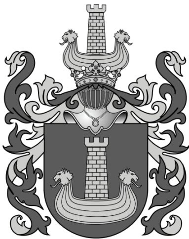
1. Obecne przedstawienie herbu Korab 27

mogły być rozwiązane dzięki pomocy zaufanych osób zatrudnionych w administracji), to możemy sobie wyobrazić, z czym borykała się tzw. szlachta zaściankowa czy zagrodowa. Po pierwsze – tak jak w przypadku Wojciecha – tu też niezaprzeczalnie powszedni był problem braku odpowiednich dokumentów w archiwach rodzinnych. Wymuszało to podróż do określonej instytucji w celu uzyskania – za odpłatą – odpisów z oryginałów. Wszczęcie samego postępowania administracyjnego w Heroldii było także kosztowne. Szczególnie gdy nie miało się w kręgach urzędowych jakiegokolwiek bliższego znajomego mogącego czuwać nad całością procesu. Nie wszystkich przedstawicieli tej grupy stać było na przeprowadzenie kosztownej procedury uzyskiwania dokumen-