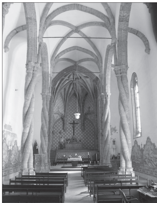
1. Kościół Jezusowy w Setúbal

prawdopodobnie z Langwedocji 10 . Budowa świątyni rozpoczęta została w roku 1492, czyli jeszcze za rządów poprzednika Manuela I Szczęśliwego, Jana II, jednak typowo manuelińskie elementy dodane zostały już po jego śmierci, około 1495 r., kiedy podjęto ostateczną decyzję co do formy przekrycia świątyni 11 . Najważniejszymi z elementów, które były następnie żywo naśladowane w późniejszych realizacjach, są spiralne kolumny, wydzielające trójnawową, halową przestrzeń korpusu kościoła 12 . Podpory te wprowadzają pewnego rodzaju „udziwienie” do dość spokojnego wnętrza świątyni. Charakterystycznym elementem przykuwającym uwagę jest także wykonane w całości z kamienia 13 sklepienie prezbiterium. Zwłaszcza jego żebra, o typowych dla tego stylu formach, które ukształtowane zostały na wzór liny i spływają na spiralne wsporniki 14 . Jednolite i surowe w wyrazie elewacje zewnętrzne organizowane są za pomocą stosunkowo masywnych przypór, zwieńczonych spiralnymi stożkami. Wszystkie te wijące się elementy, zastosowane w dekoracji kościoła symbolizować miały fale i podbój mórz przez Portugalie.