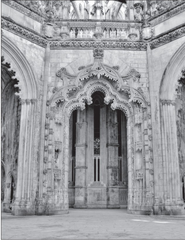
3. Kaplice w Batalha, portal wejściowy, fot. P. Waškowiak

spoczynku 33 . Budowla nie została jednak ukończona za jego życia, przechodząc pod opiekę następcy tronu – Edwarda I Aviza. Nowy władca, chcąc okazać swoją hojność, nakazał wybudować oktogonalną kaplicę o siedmiu niszach. Podzielając los ojca, Edward nigdy nie doczekał się ukończenia budowy, którą niemal 50 lat po jego śmierci postanowił sfinalizować król Manuel I. Jednakże po ostatecznym wyborze przez Szczęśliwego klasztoru Hieronimitów w Belém na mogiłę królewską budowa kaplic została ostatecznie porzucona.