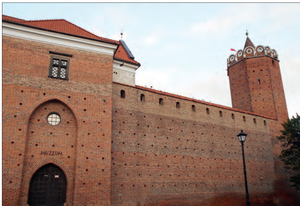
4. Zamek królewski w Łęczycy.

Stary gród ( castrum antiquum ) został wymieniony w 1357 r., kiedy to Kazimierz Wielki wydał przywilej dla dóbr arcybiskupstwa gnieźnieńskiego 25 . Stary gród został zidentyfikowany jako obiekt w obecnym Tumie, który funkcjonował jeszcze we wspomnianym roku (nie został zniszczony w czasie najazdu litewskiego w 1294 r.) obok nowej inwestycji obronnej, jaką był zamek wzniesiony przez Kazimierza Wielkiego 26 . O tym fakcie informuje nas Kronika katedralna krakowska , w której odnotowano, że monarcha obwarował w ziemi łęczyckiej samo miasto, czyli mury miejskie i zamek („in terra Lanciensi ipsam civitatem et castrum”) 27 .