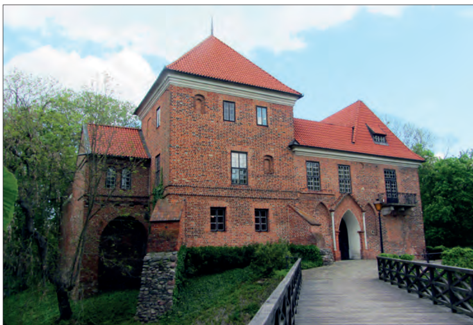
5 a–b. Zamek w Oporowie. Widoki od strony zachodniej i północno-zachodniej