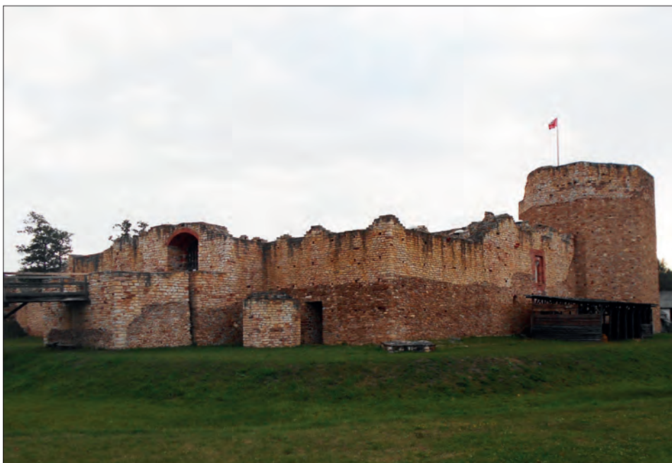
3. Zrekonstruowane ruiny zamku królewskiego w Inowłodzu.

Krośniewice (powiat łęczycki, parafia w miejscu). Z 1508 r. pochodzi informacja na temat fortalicji znajdującej się w mieście Krośniewice 22 . W 1515 r. Jan, dziedzic i pleban w Krośniewicach, dokonał zamiany swoich dóbr, tj. połowy miasta Krośniewic wraz z dworem, fortalicją i fosą, wsi Kajew, Lasocin i połowy innych wsi przynależnych do Krośniewic, z Mikołajem z Kretkowa, wojewodą brzeskim, swoim bratem rodzonym ciotecznym, na wieś Kępka w powiecie kowalskim i dopłatę 6000 grzywien groszy szerokich 23 .