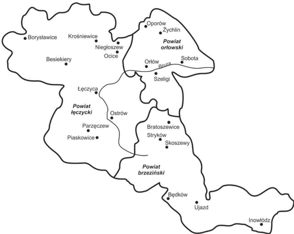
8. Rozmieszczenie obiektów obronnych na obszarze ziemi łęczyckiej w okresie jagiellońskim, oprac. T. Nowak, Ł. Ćwikła

Warto zauważyć, że w toku podjętej analizy pojawiło się także określenie mons , które odpowiada polskiemu terminowi kopiec lub grodzisko.