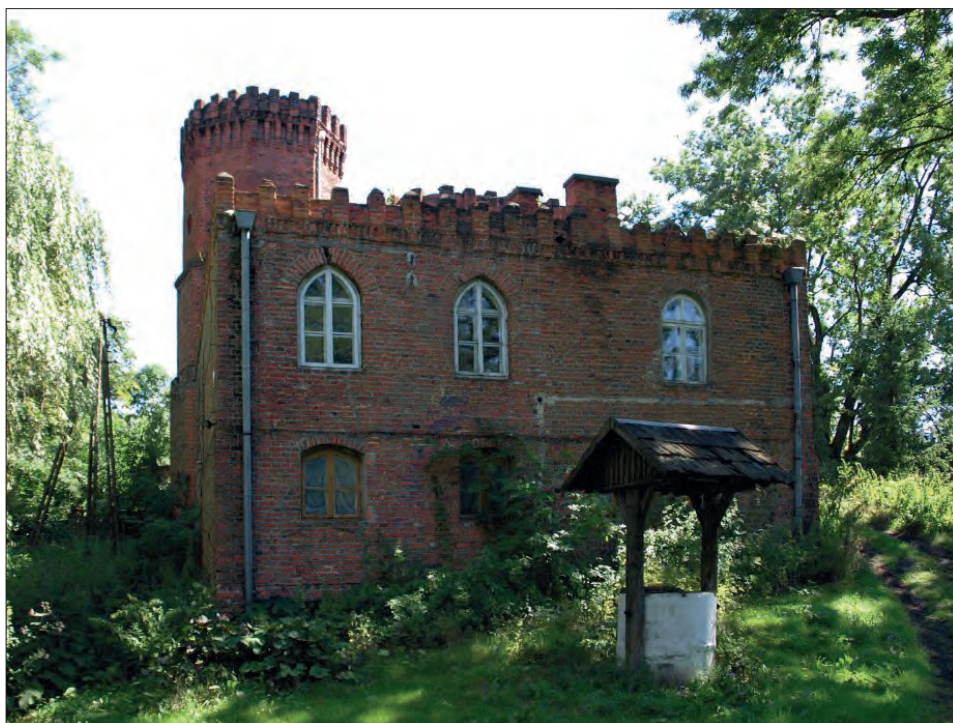
6. Zamek w Sobocie – elewacja zachodnia

przemocą Skoszew i okolicznych wsi nastąpiło przed 31 maja 1482 r., bowiem tego dnia woźny sądowy zeznał, że Piorunowscy i ich pomocnicy nie chcą zagarniętych siłą dóbr zwrócić Stanisławowi Siodłkowskiemu. W swym pozwie złożonym w drugiej połowie 1482 r. Siodłkowski oskarżał Piorunowskich i ich pomocników, że po zajęciu dóbr skoszewskich zagarnęli czynsze i inne dochody, zboża, bydło i sprzęty domowe wartości 200 grzywien 45 .