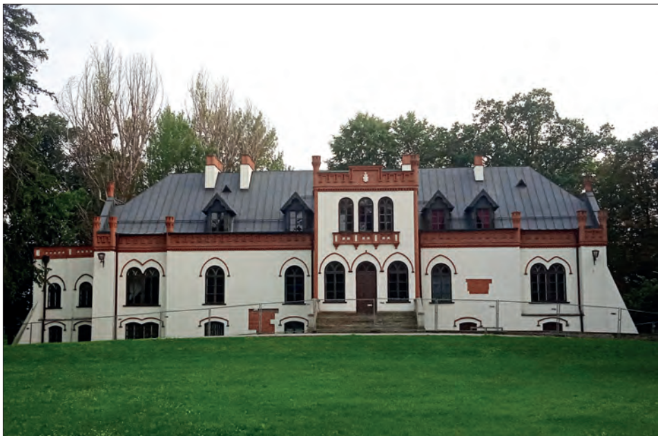
7. Pałac w Ujeździe, elewacja frontowa – stan współczesny.

4000 florenów (2000 florenów posagu i drugie tyle wiana). Zapis obejmował także część tutejszego zamku (fortalicji alias twierdzy) 63 . Średniowieczny zamek obecnie nie istnieje, a jego relikty zostały wkomponowane w bryłę dziewiętnastowiecznego pałacu Ostrowskich 64 .