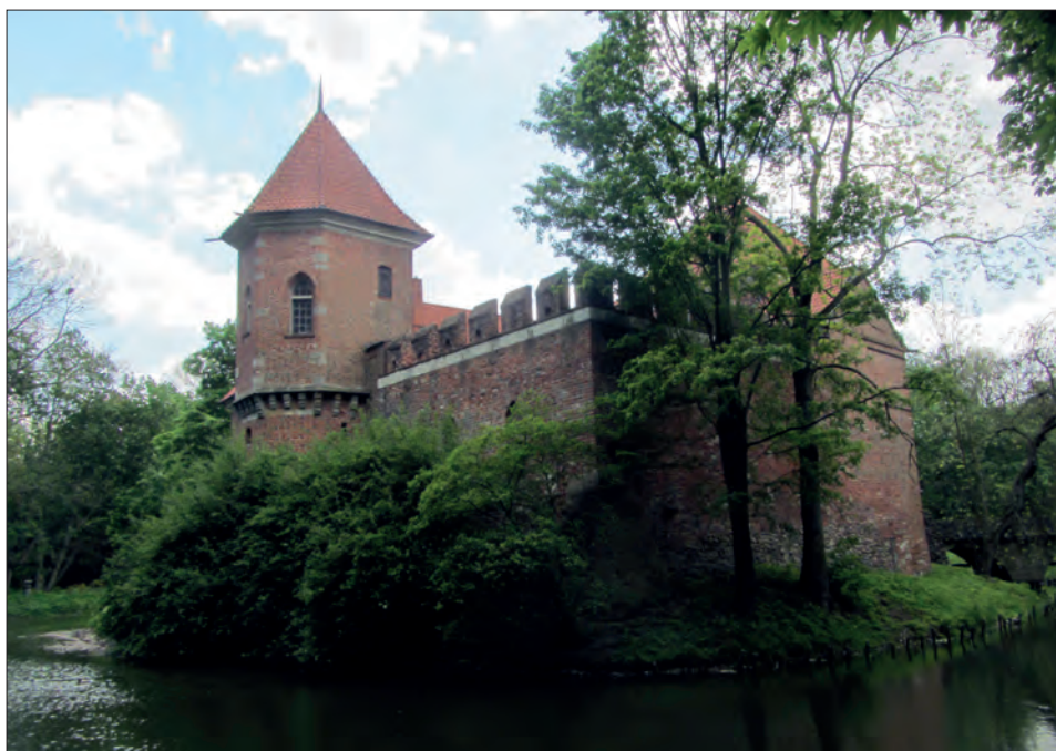
5 c–d. Zamek w Oporowie. Widoki od strony południowo-wschodniej i północno-wschodniej.