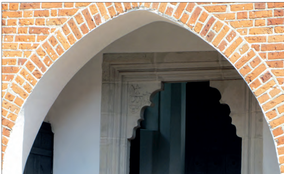
5 e. Zamek w Oporowie. Kaplica zamkowa z herbem Sulima Oporowskich.

Nowa budowla odpowiadała ambicjom Władysława, który czerpiąc dochody z dóbr stołowych, posiadał odpowiednie fundusze do realizacji i pokrycia kosztów inwestycji w dobrach rodzinnych. W 1509 r. Jan z Oporowa, kasztelan i starosta kruszwicki, zeznał, że cały swój dział dziedziczny w mieście Oporów i Kurowie wraz z fortalicją w Oporowie zastawił Andrzejowi z Oporowa, kasztelanowi brzeskiemu, za 100 kop groszy 34 .