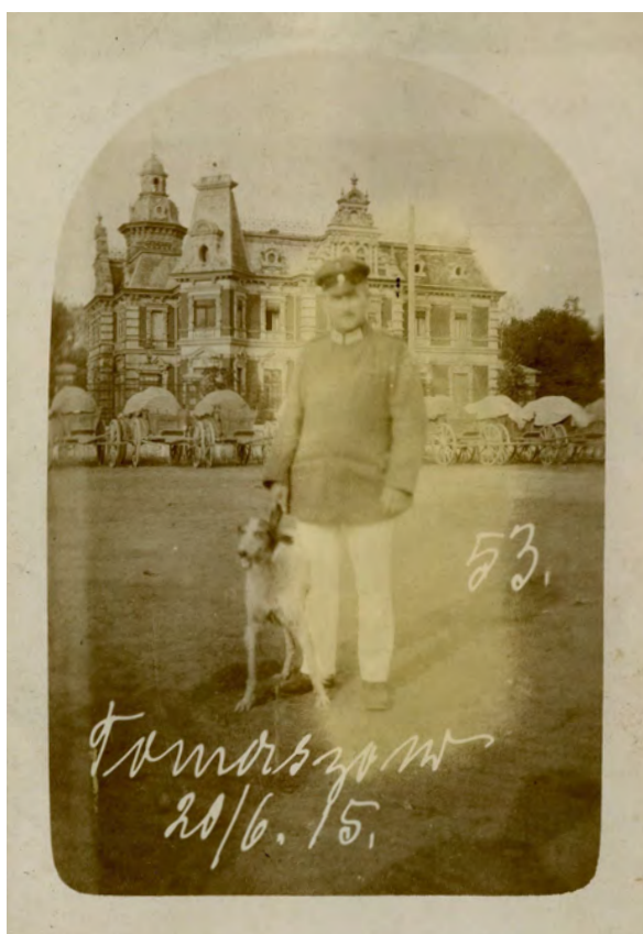
Ilustr. 12. Oficer niemiecki sfotografowany na tle pałacu M. Piescha, zajętego przez okupanta na potrzeby wojenne (fot. opatrzona datą 20 VI 1915).