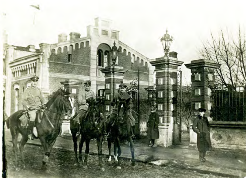
Ilustr. 7. Żołnierze niemieccy na koniach na ul. św. Tekli (ob. N. Barlickiego) w Tomaszowie Mazowieckim.