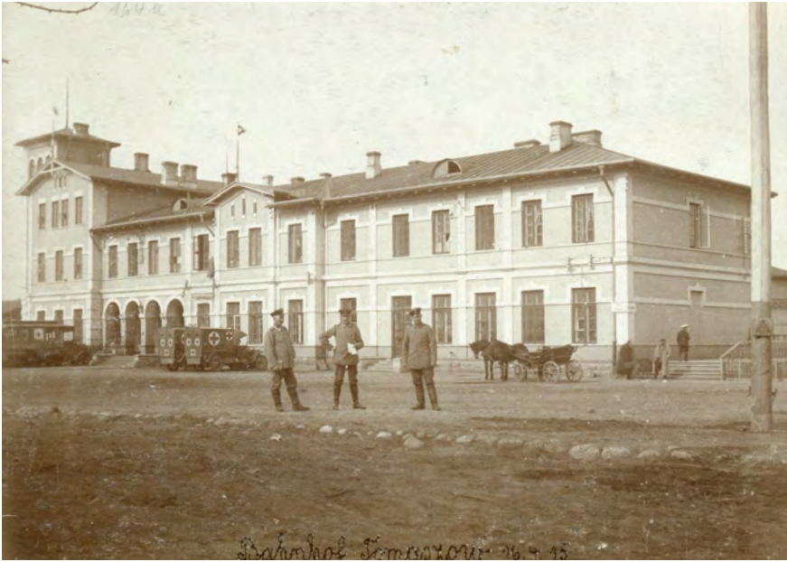
Ilustr. 9. Wojsko niemieckie stacjonujące przed dworcem kolejowym w Tomaszowie Mazowieckim. Fot. ze zbiorów Jerzego Pawlika.