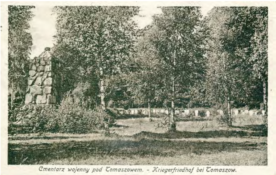
Ilustr. 6. Cmentarz wojenny żołnierzy niemieckich w Tomaszowie Mazowieckim.