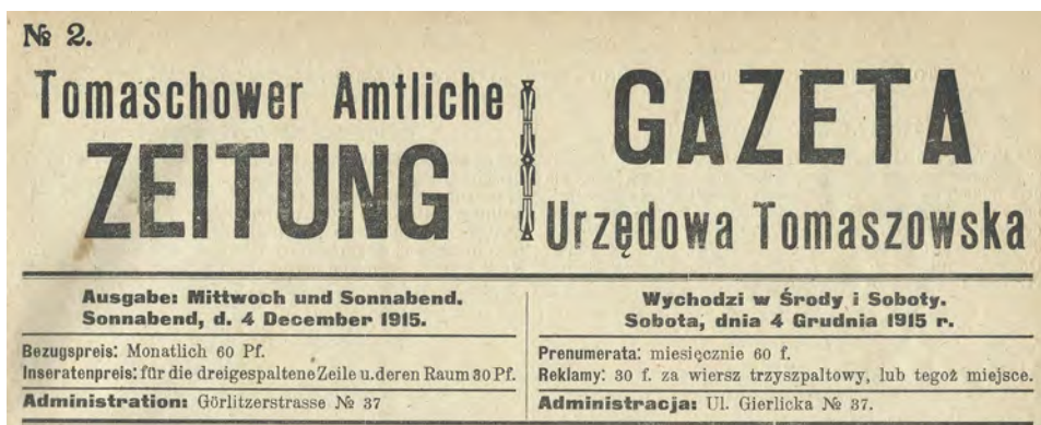
Ilustr. 1. Winieta pisma „Tomaschower Amtliche Zeitung”, noszącego alternatywną nazwę polską „Gazeta Urzędowa Tomaszowska”.