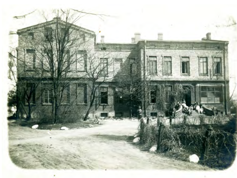
Ilustr. 8. Szpital Miejski w Tomaszowie Mazowieckim (przy ul. św. Antoniego) zajęty na potrzeby wojenne przez okupanta niemieckiego. Wejścia do szpitala strzeże uzbrojony wartownik.