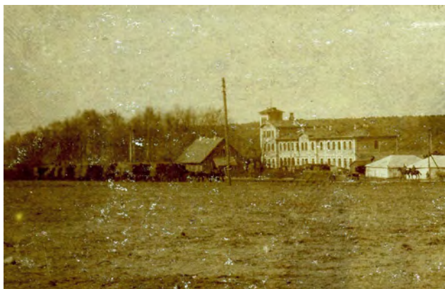
Ilustr. 11. Niemieckie wojska okupacyjne stacjonujące w okolicy dworca kolejowego w Tomaszowie Mazowieckim.