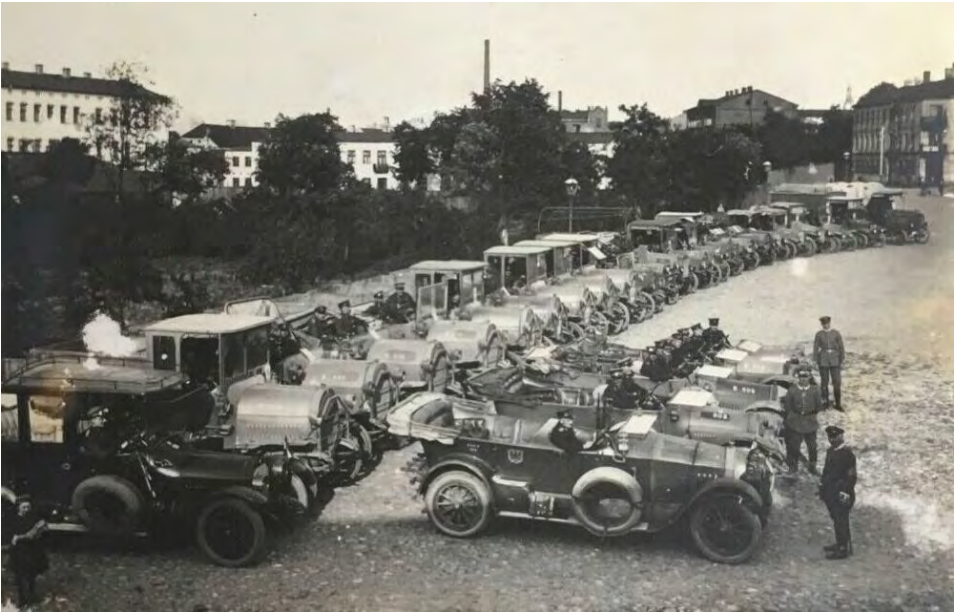
Ilustr. 3. W Generalnym Gubernatorstwie Warszawskim wprowadzono zakaz handlu ulicznego. Na opustoszałym targowisku w Tomaszowie Mazowieckim (obecnie pl. G. Narutowicza) stacjonuje wojsko niemieckie.

a zwłaszcza mięsem, wyrobami mięsnymi, smalcem, rybami, masłem i pieczywem. Wobec niedostatku żywności i szerzącego się w Tomaszowie Mazowieckim głodu, wozy wiozące ziemniaki do miasta były w czasie transportu niejednokrotnie okradane 21 . Trudną sytuację aprowizacyjną wykorzystywali niektórzy piekarze, sprzedawcy cukru i mąki, przekraczając dopuszczalne najwyższe ceny na te artykuły 22 .