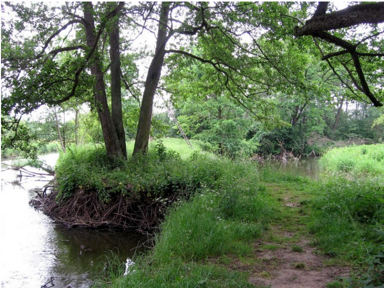
Fot. 1. Koryto Rawki. Szyja meandrowa o szerokości 1,2 m chroniona przed erozją bocznią przez system korzeniowy drzew (fot. E. Koboжек, stan z maja 2008 r.)

W innym przypadku bobry przyspieszyły odcięcie zakola. W Rawce w wielu miejscach występują szyje meandrowe o szerokości 3–1,2 m. Przez cztery lata obserwowano podcinanie szyi o szerokości 1,2 m, którą dość dobrze chroniła przed erozją gęsta sieć korzeni drzew (fot. 1). Bobry wykopały w niej kanał, przez który w czerwcu 2008 r. w czasie wysokiego stanu zaczęła przelewać się woda. W ciągu jednej nocy szyja została rozmyta. Rzeka skręciła swój bieg, a dawne zakole zostało odcięte (fot. 2). W analizowanym stanowisku bobry skutecznie przyspieszyły proces przecięcia szyi meandrowej i powstania starorzecza. W odciętym zakolu występuje jeszcze woda, a w czasie wyższych stanów ożywa przepływ.