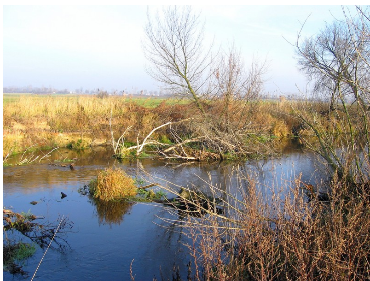
Fot. 3. Drzewo zalegające w uregulowanym korycie Bzury ścięte przez bobry zainicjowało proces erozji bocznej

Photo 3. Tree lying in the regulated channel of the Bzura river, cut down by beaver, initiated the process of lateral erosion