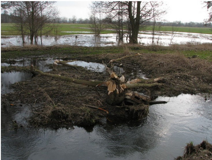
Fot. 5. Dolina Igli. Warstwa wody na równinie zalewowej w sąsiedztwie tamy bobrowej (fot. E. Koboжек, 2010)