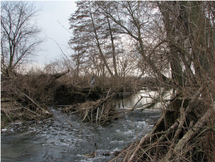
Fot. 4. Częściowo uszkodzona tama bobrowa w korycie Igli (stan z marca 2010)