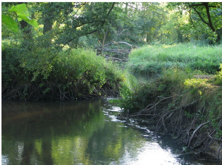
Fot. 2. Koryto Rawki. Przecięta szyja meandrowa przycięta przy współudziale działalności bobrów (stan z czerwca 2008)