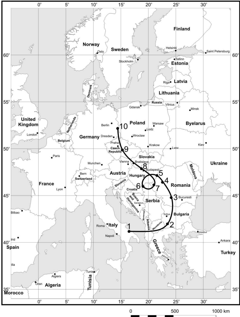
Rys. 1. Trajektorija cyklonu śródziemnomorskiego Yvette. Okres od 14.05.2014, 00 UTC do 18.05.2014, 12 UTC. Punkty na trajektorii ponumerowano co 12 godz.