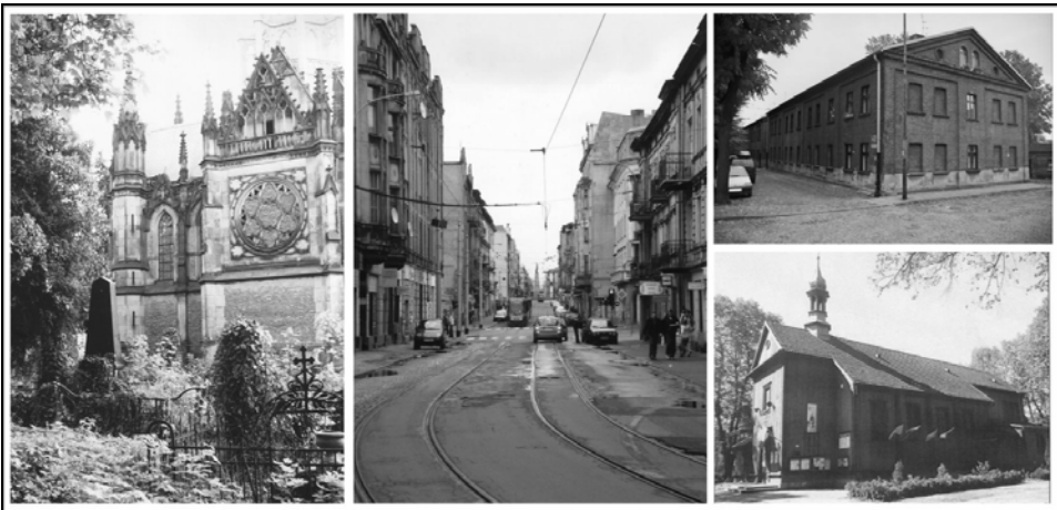
Rys. 4. Miejsca w Łodzi, w których czas się zatrzymał: Cmentarz Stary, ulica Legionów, Księży Młyn, Kościół pw św. Józefa

„Ten odcinek ulicy pozostaje niezmienny od czasów mojego dzieciństwa. Panuje tutaj całkowita stagnacja. Nawet sklep spożywczy Społem, wspaniała relikwii przeszłości, pozostał wciąż w tym samym miejscu”.