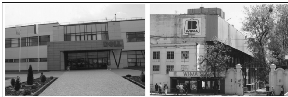
Rysunek 2. Dysproporcje w przestrzeni miasta – miejsca, w których widać rozwój i miejsca, w których widać kryzys: nowe i stare obiekty przemysłowe – Dell i Wifama

„Ewidentny kryzys na terenie miasta widoczny jest w wielu zdewastowanych budynkach pofabrycznych. Najlepszym tego przykładem jest budynek Nowej Tkalni Scheiblera. Po potężnej fabryce pozostały tylko mury obwodowe (...)”.