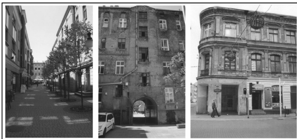
Rysunek 1. Dysproporcje w przestrzeni miasta – miejsca piękne i brzydkie: Podwórka przy ul. Piotrkowskiej, kamienica na rogu ulic Piotrkowskiej i G. Narutowicza.

„Kwintesencja stereotypowej, zaniedbanej Łodzi. Jestem świadoma, że takich przykładów jest w mieście więcej. Widok ulicy Legionów szczególnie mnie jednak rani, gdyż jest to centrum, najbliższa okolica ulicy Piotrkowskiej, Manufaktury, Starego Rynku. Najgorsze jest to, że poszczególne kamienice są interesujące pod względem architektonicznym, jednak brak zainteresowania skazuje je na bolesną i nieuchronną zagładę”.