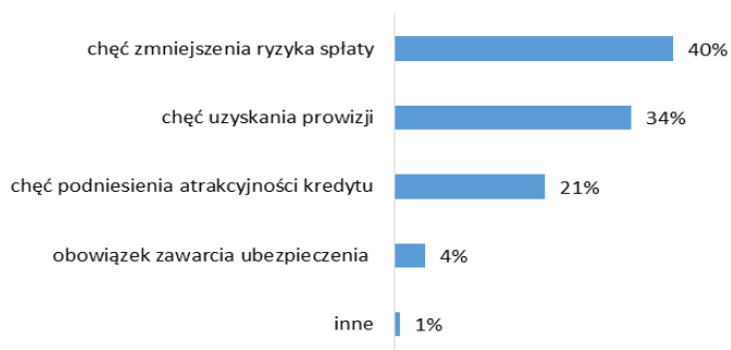
Wykres 2. Powody oferowania przez banki ubezpieczenia podczas zawierania umowy kredytu