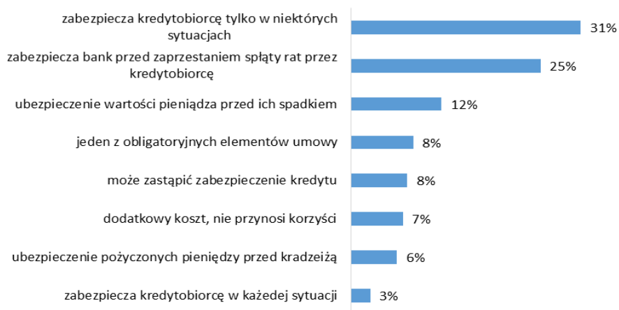
Wykres 1. Znaczenie ubezpieczenia kredytu