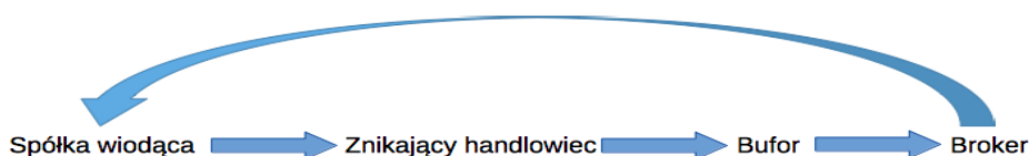
Rysunek 2. Łańcuch transakcji w przestępstwach karuzelowych