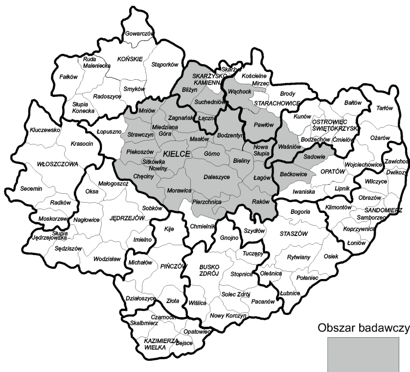
Ryc. 1. Region Gór Świętokrzyskich według podziału administracyjnego