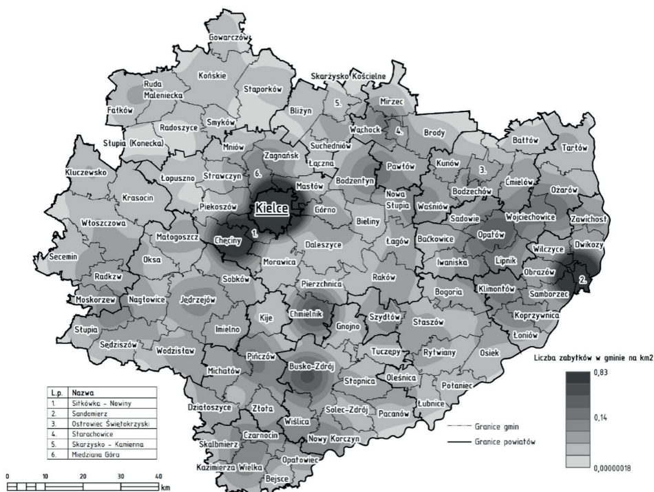
Ryc. 2. Liczba zabytków na jednostkę powierzchni w gminach województwa świętokrzyskiego w 2016 roku

pleks sakralny został uznany za Pomnik Historii i dnia 15 marca 2017 roku 1 wpisany na listę najcenniejszych obiektów w Polsce. Obejmuje on pobenedyktynski zespół klasztorny z XV wieku, w tym m.in.: kościół, dzwonnice, bramę wschodnią, system średniowiecznych dróg, a także przedchrześcijańskie obwałowania kamienne na Łysej Górze (datowane na IX–XI w.), które istniały zanim przybyli benedyktyni 2 . Miejsce to jest uznawane za jedno z najważniejszych na obszarze słowiańszczyzny (Kiniorska, Brambert 2017).