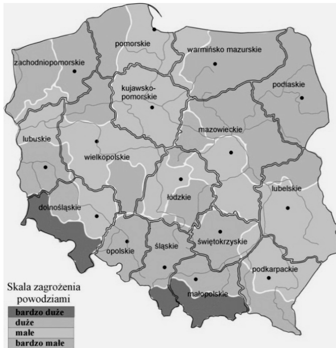
Rys. 1. Regionalizacja powodzi w Polsce