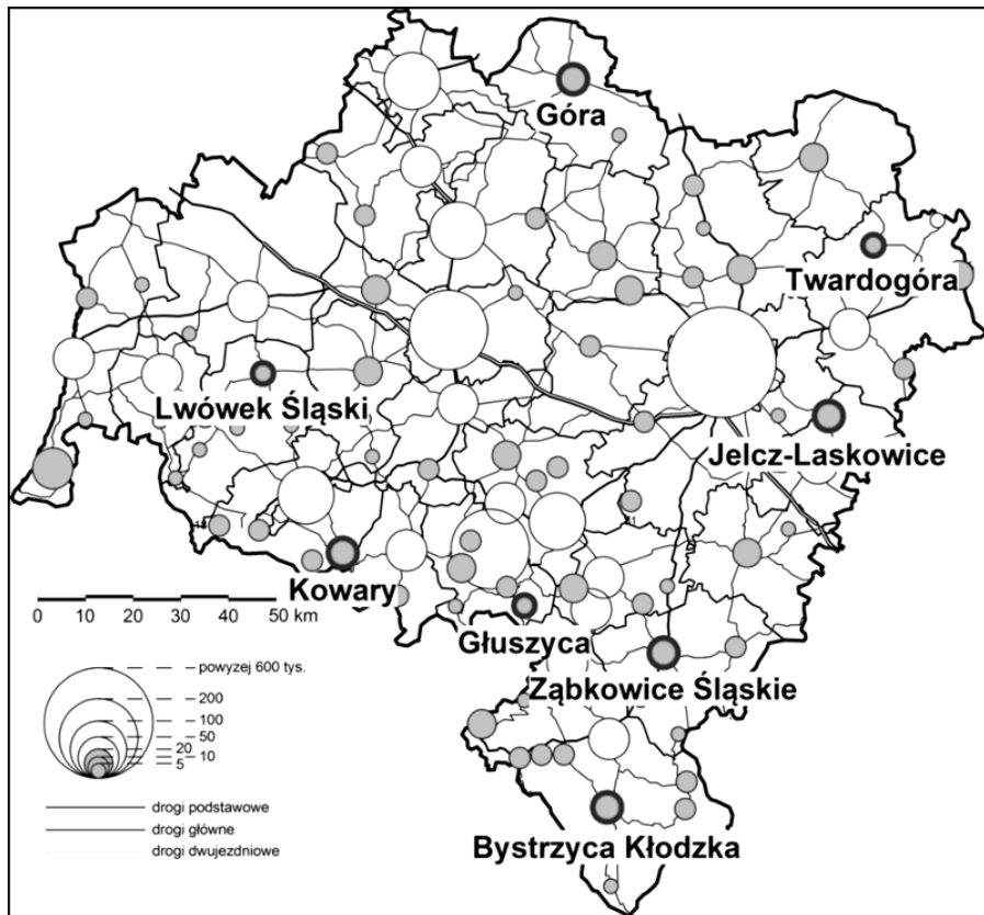
Rys. 1. Wybrane małe miasta województwa dolnośląskiego