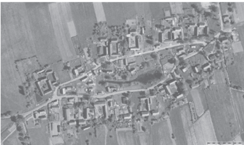
Ryc. 3. Współczesny układ przestrzenny wsi Swolowo