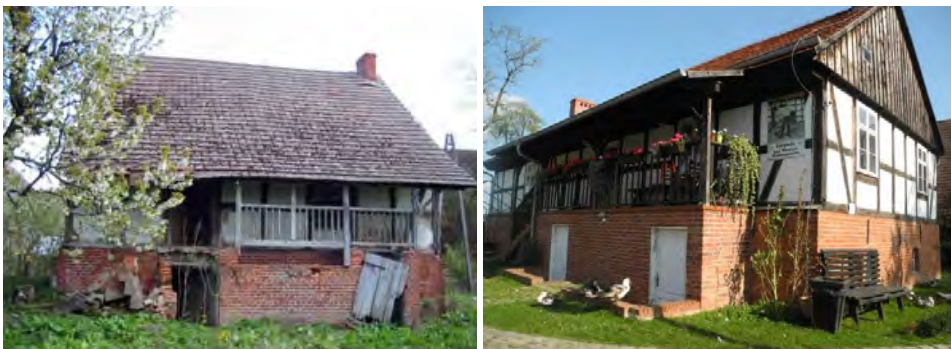
Fot. 3. Gospoda pod wesołym Pomorzaniem w Swołowie (przed i po rekonstrukcji)