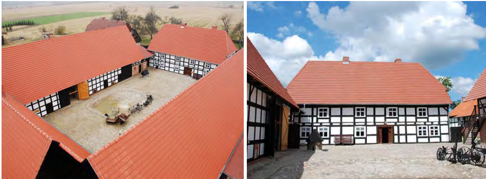
Fot. 1. Układ budynków zrekonstruowanej Zagrody Albrechta (nr 8)