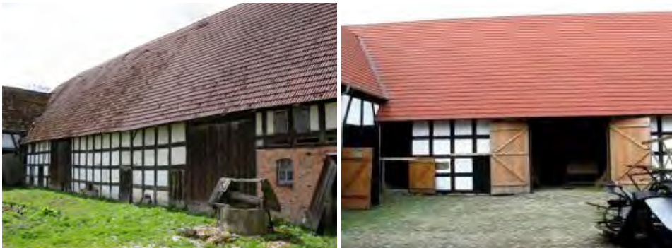
Fot. 2. Stodół – muzealna ekspozycja maszyn i narzędzi rolniczych oraz sprzętu używanego do prac gospodarskich (przed i po rekonstrukcji)