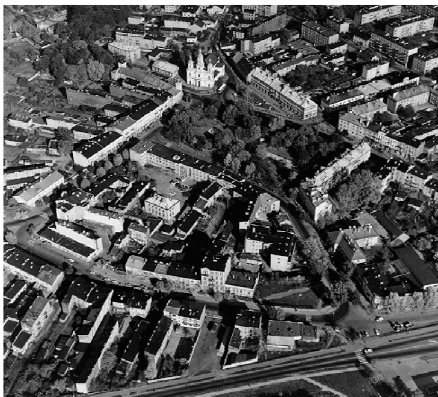
Fot. 1. Widok miasta lokacyjnego w Radomsku „z lotu ptaka”. Na pierwszym planie rynek o trapezoidalnym kształcie