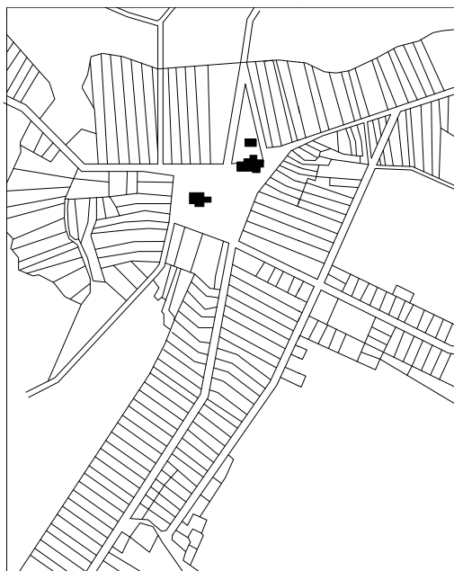
Rys. 1. Radomsko, woj. piotrkowskie. Odrys planu miasta z 1819 r.