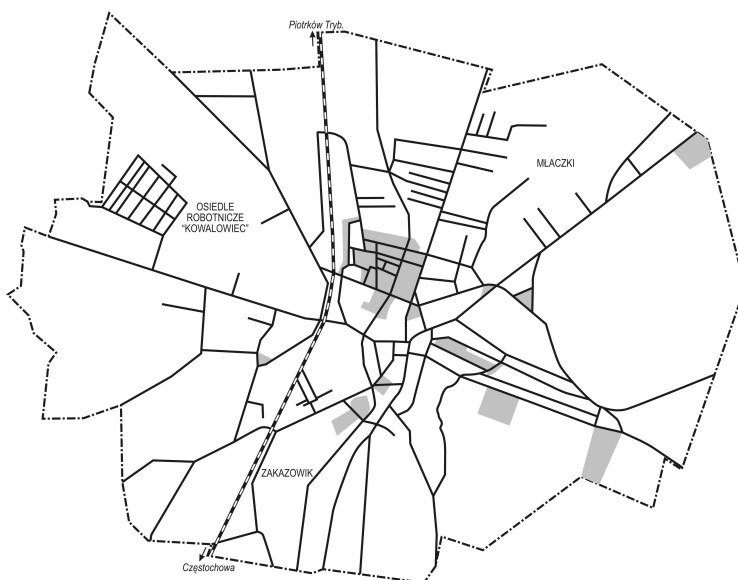
Rys. 4. Radomsko w 1932 r.