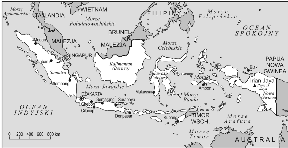
Rys. 1. Indonezja

Indonezji zakończyły się fiaskiem. Indonezja zerwała Unię, a w 1960 roku także stosunki dyplomatyczne z Królestwem Niderlandów nacjonalizując mienie należące do obywateli tego państwa 11 (Balicki, Bogucka 1989, s. 412; Sobczyński 2006, s. 123–125).