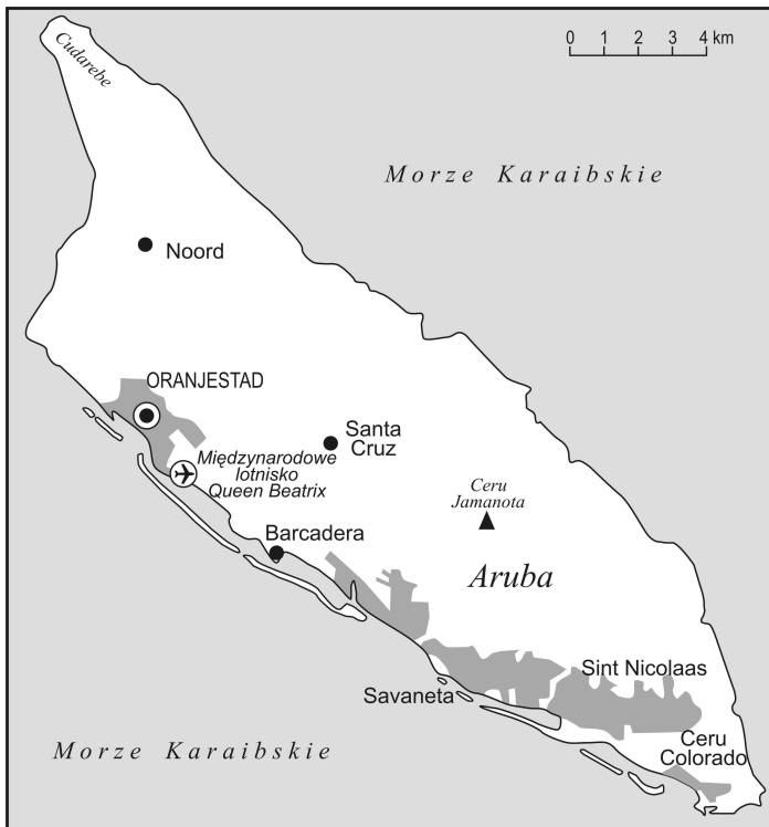
Rys. 4. Aruba