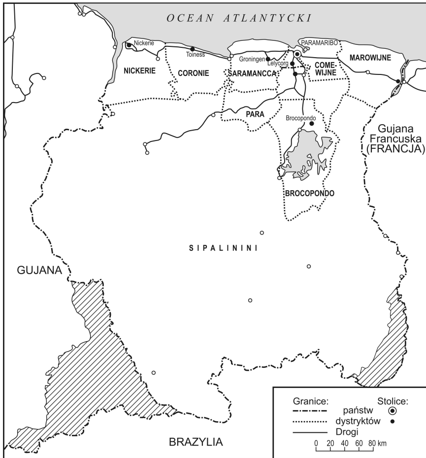
Rys. 2. Surinam